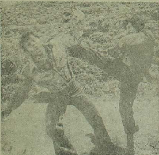
செயலி சூடாய் அணிந்தது

ஒருதலை காதல் இன்றே குடும்பத்தோடு பார்த்துமகிழங்கள்