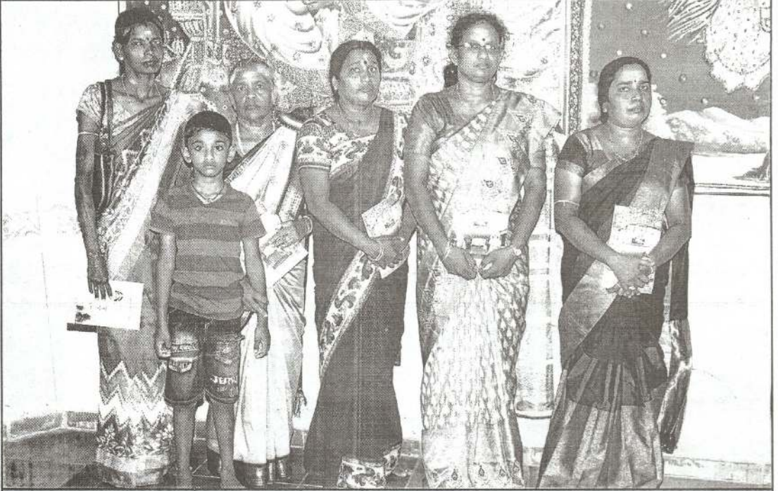
ஞானச்சுடர் சிறப்புப்பிரதி பெற்றோரிற் சிலர்...