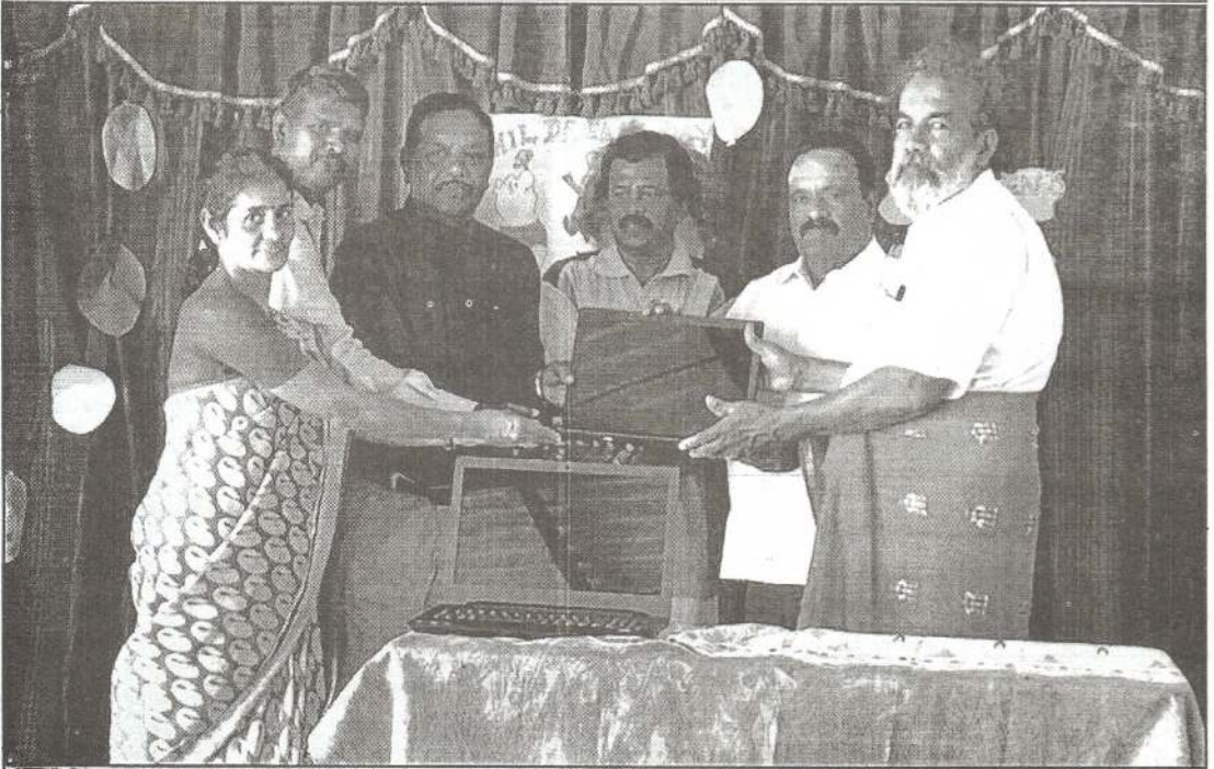
சமுதாயப் பணிகளின் வரிசையில் மாத்தளை கலைமகள் மகா வித்தியாலய பயன்பாட்டிற்காக இரண்டு மடக் கணனிகள் ஆச்சிரம சுவாமிகளால் வழங்கப்பட்டது.