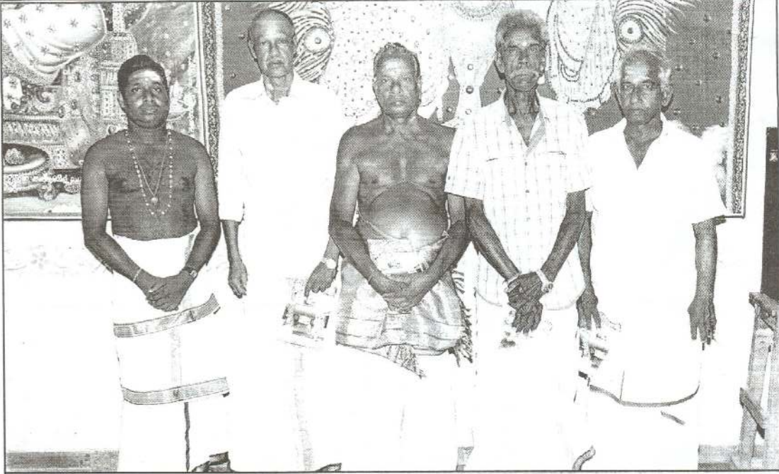
ஞானச்சுடர் சிறப்புப்பிரதி பெற்றோரிற் சிலர்...