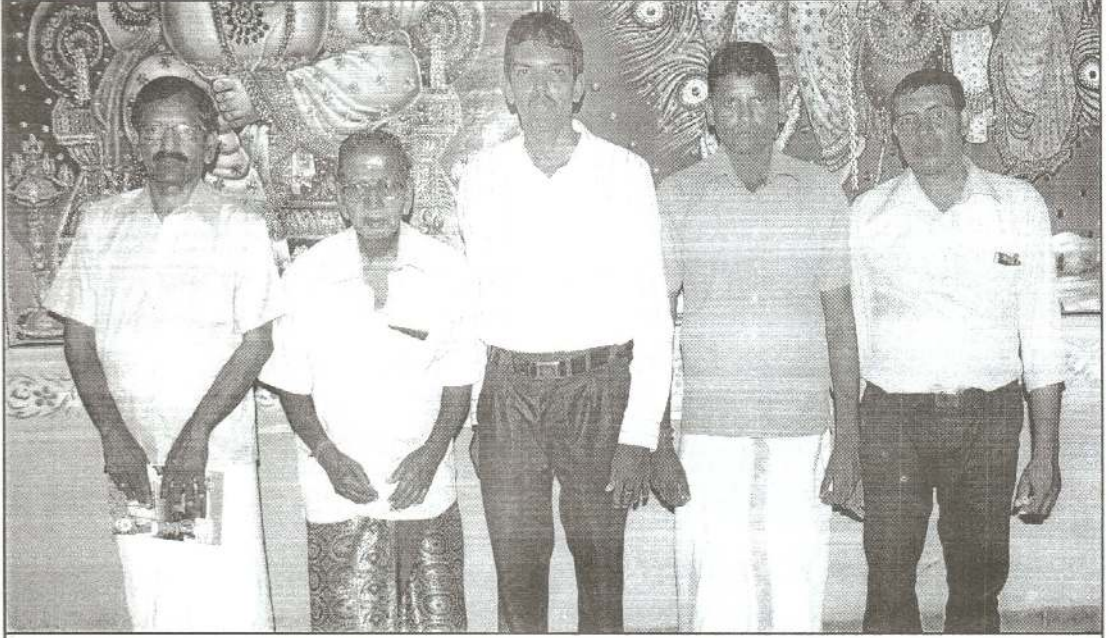
ஞானச்சுடர் சிறப்புப்பிரதி பெற்றோரிற் சிலர்...