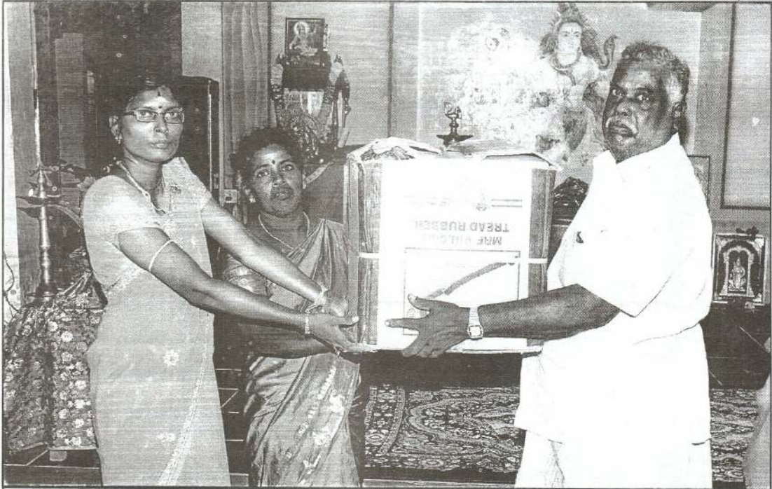
சமுதாயப் பணிகளில் யா/ அல்வாய் வடக்கு றோ.க.த.க. பாடசாலை வாணி விராவினை முன்னிட்டு 97 மாணவர்களுக்கான பரிசுப் பொருட்கள் வழங்கப்பட்டது.