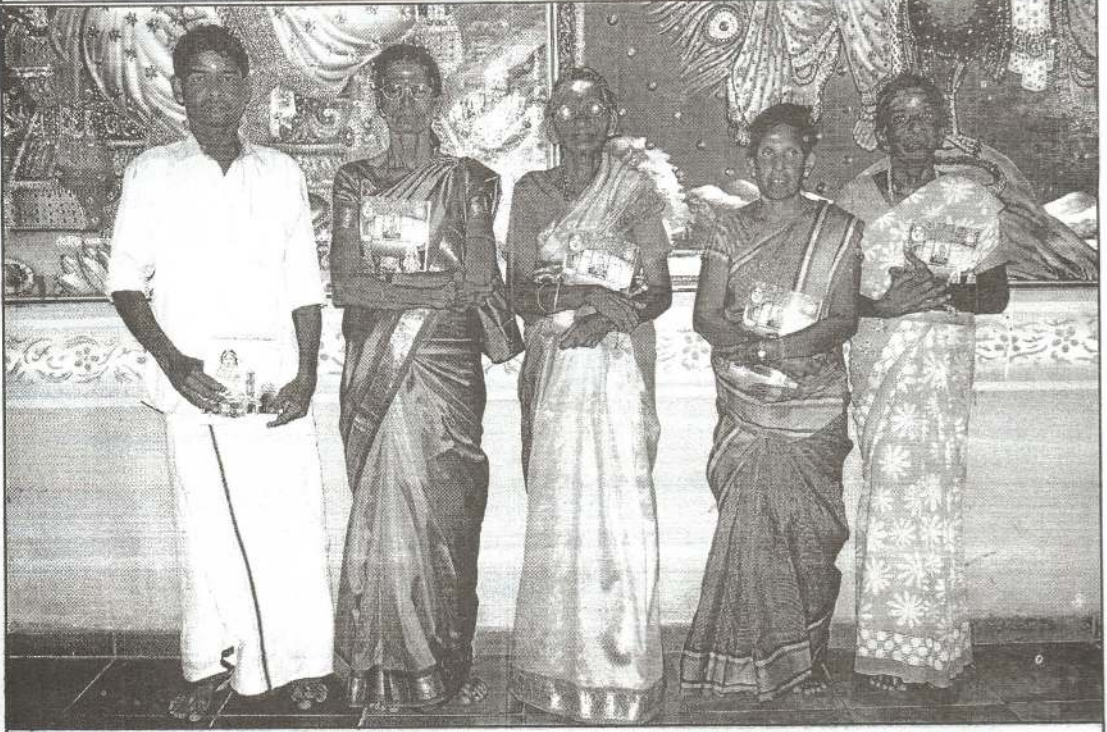
ஞானசகடர் சிறப்புப்பிரதி பெற்றோரிற் சிலர்...