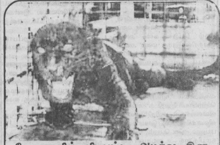
கேரளாவில் பிடிபட்ட அயூர்வ இன கறுப்பு புலியை படத்தில் காணலாம்