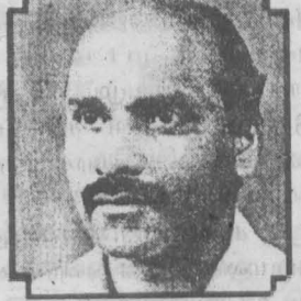
விசாரணைக்கு உட்படுத்தப்பட்டு இருந்தார்.