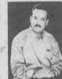
(ஏறாவூர் நிருபர்) மட்டக்களப்பு மேல் நீதிமன்றத்தில் பயங்கரவாத தடைச் சட்டத்தின் கீழ் வழக்குத் தாக்கல் செய்யப்பட்டு தற்போது வெலிக்கடை மற்றும் கருத்துறை சிறைச்சாலைகளில்