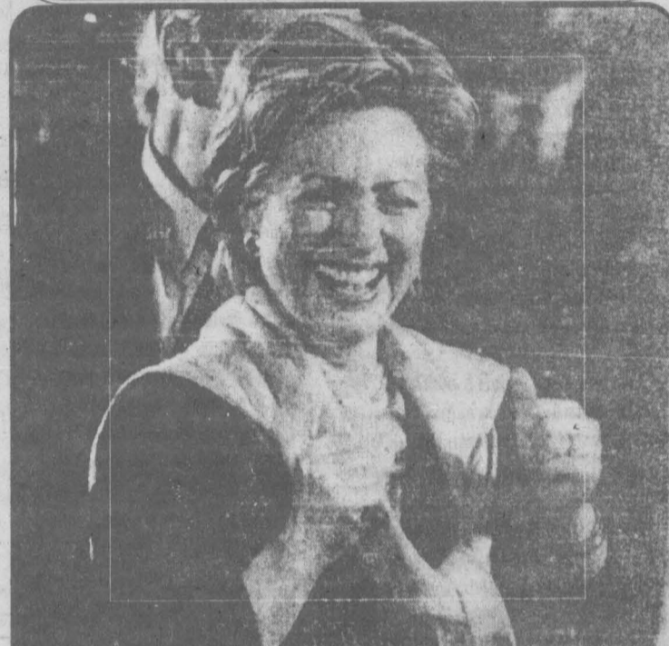
நியூயோக் நகரத் தொகுதியில் ஜனநாயகக்கட்சி வேட்பாளராக சென்றமைக்குப் போட்டியிட்டு அமெரிக்க வெற்றியிட்ட ஹிலாரி ரொடாம் கிளிண்டன் அத்தேர்தலில் வெற்றியிடிபுதன் மூலம் தேர்தலில் போட்டியிட்டு வெற்றியிட்டிய முதலாவது ஜனாதிபதியின் மனைவி என்றும் "நாட்டின்

முதல் மங்கை" சட்டிய வெற்றி என்ற பெருமையையும் பெறுகிறார். தேர்தல் பிரச்சாரத்தின் போது ஆதரவாளர்களின் உற்சாகவரவேற்பை மகிழ்ச்சியுடன் ஏற்றுக் கொள்ளும் காட்சி இது.