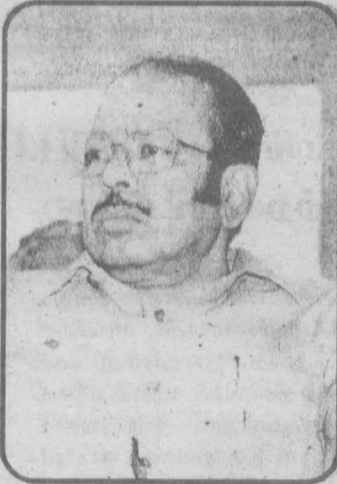
போசனையும் கைவிடப்பட்டிருப்பதாக கூறப்படுகிறது.

ரது உடல் தாங்குமா என்ற சந்தேகமும் ஏற்பட்டிருப்பதால் அந்த பதவி வகித்தவர். 1991ம் ஆண்டு கலைஞர் கருணாநிதியின் தலைமையில் தமிழ்நாட்டில் இருந்த கட்சியை குடியரசு தலைவராக இருந்த ஆர்.வெங்கட்ராமன் கதைத்த போது தமது ஆலோசனை கேட்காமல் கலைத்ததை ஆட்சேபித்து வந்ததனால் தமது பதவியை ராஜினாமா செய்து வெளிப்பேறினார். புதிய உத்தராஞ்சல் சட்டசபையில் 30 உறுப்பினர் உள்ளனர். ஒரு கோடி மக்களைக்