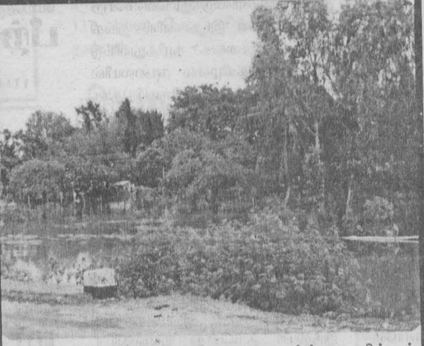
கல்லடியில் தேவாலயத்தை சூழ்ந்து நிற்கும் வெள்ளம்.