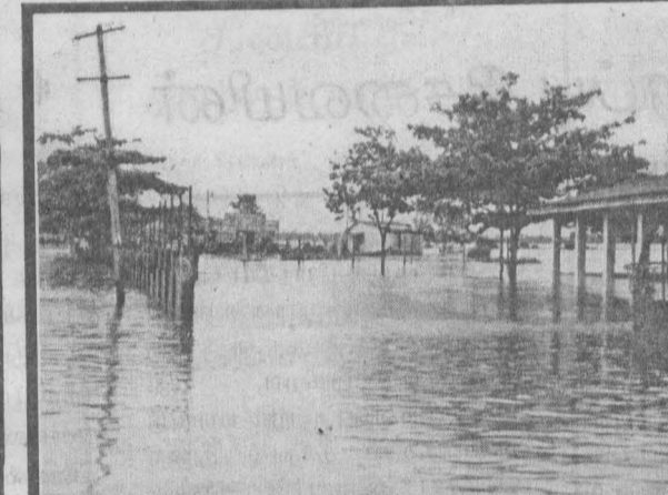
மட்டக்களப்பு நகர் பூங்காவுக்கும் போருந்து நிலையத்திற்கும் இடைப்பட்ட பகுதி