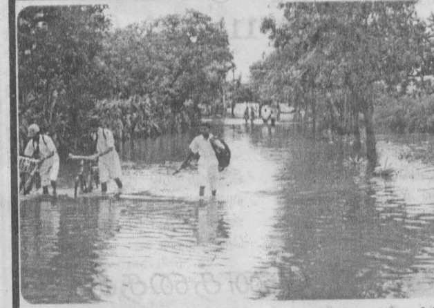
வாலிக்கரை வீதி. ஒரு பகுதி நிலில் முழுகிய நிலையில்