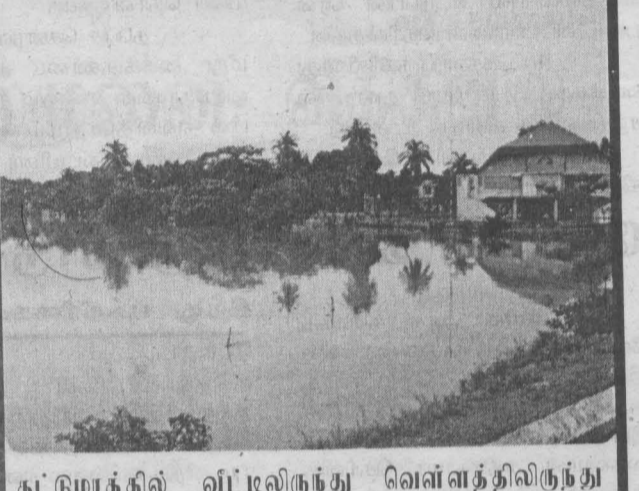
கட்டுமரத்தில் வீட்டிலிருந்து வெள்ளத்திலிருந்து வெளியேறும் ஒரு குடும்பம் கல்லடியில்