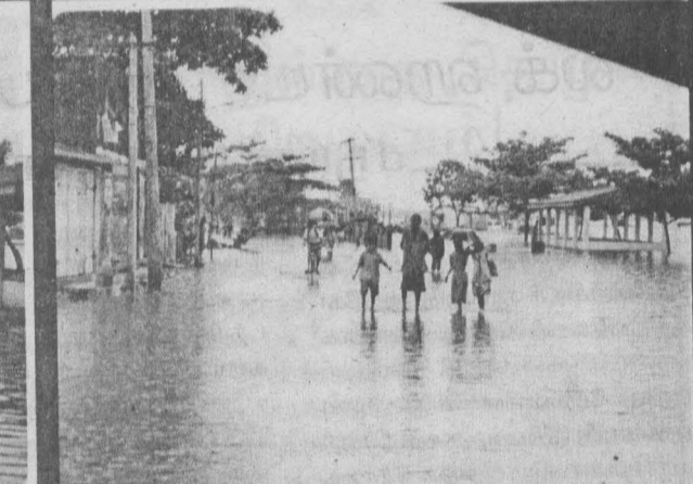
மட்டக்களப்பு பேருந்து நிலையப் பகுதி