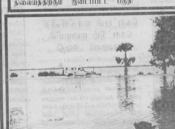
மட்டு- திருகோணமலை பிரதான வீதியினூடு சந்துருக்கொண்டான் பகுதியில் ஐ.சி.ஆர்.சி.வாகனம் மட்டுமே பயணித்தது.