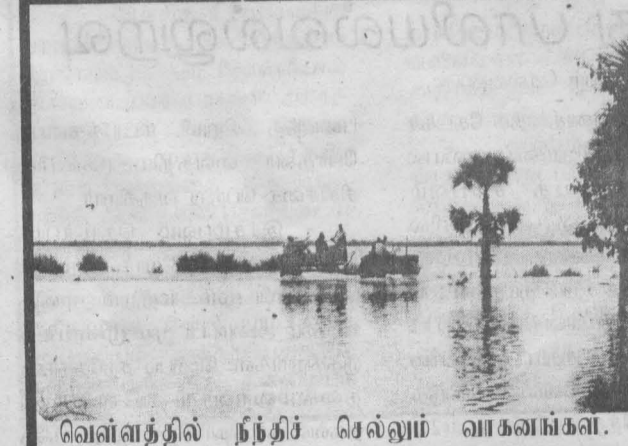
வெள்ளத்தில் நீந்திச் செல்லும் வாகனங்கள்.

இராணுவம், பொலிஸ், அதிரடிப்படையினர் கட்டாக் மேற்கொண்ட இத்தேடுதல் காலை தொடக்கம் மாலை வரை நீடித்தது. இத்தேடுதலில் பலர் தீவிரவிசாரணைக்கு உட்படுத்தப்பட்டனர்.