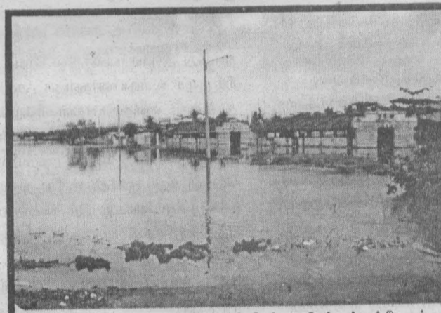
மட்டு/ பேருந்து நிலையத்தின் பின்பக்கத்தோற்றம்