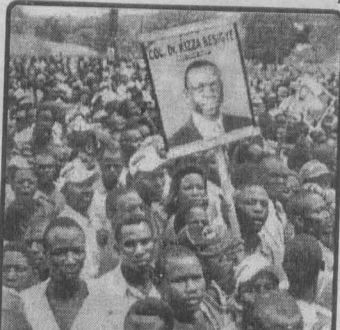
டாக்டர் பெசிக்ஜியின் ஆதரவாளர்கள் பேரணியில் காணப்படுகின்றனர்.

எதிர்த்தரப்பின் ஜனாதிபதி அபேச்சர் டாக்டர் பெசிக்ஜி விடுவதாக இல்லை. முசவேனியின் ஆட்சி ஊழல் நிறைந்தது என்றும் சலுகைகள் பட்டர்ந்தன என்றும் (Nepotism) கொங்கோ யுத்தத்தில் கலந்து கொண்ட களங்கமான அரசு என்றும் சுட்டிக் காட்டியுள்ளார். அத்துடன் தன்னிச்சைப்படி