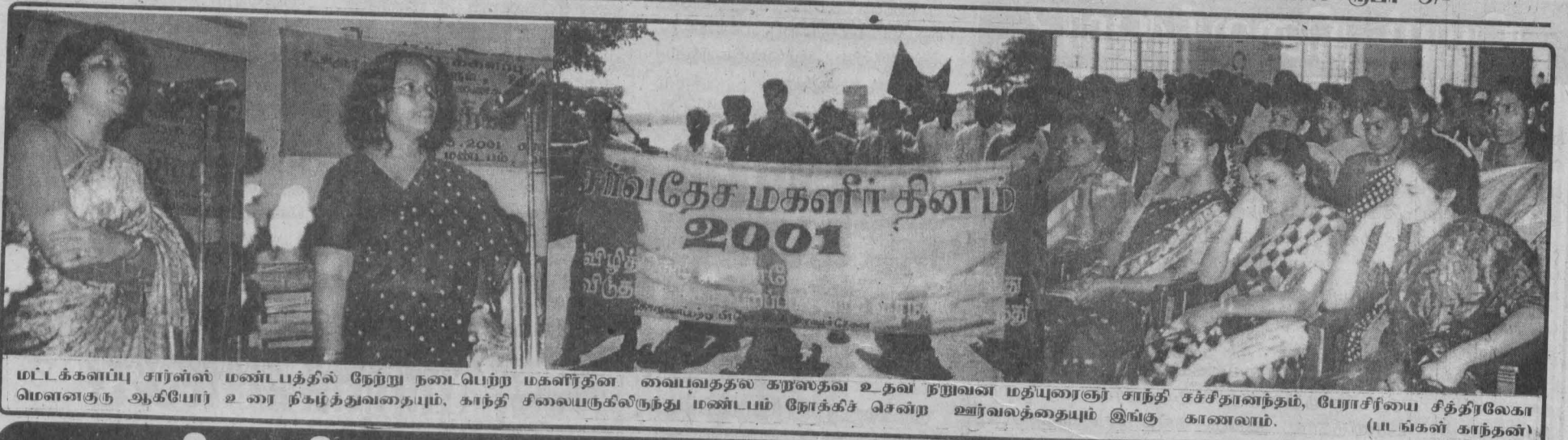
மட்டக்களப்பு சார்ன்ஸ் மண்டபத்தில் நேற்று நடைபெற்ற மகளிர் தின விவதேச மகளிர் தினம் 2001 விழாவில் கலந்துகொண்ட பெண்கள்.

ஒளி - 01 - கதிர் - 325 17.03.2001 சனிக்கிழமை பக்கங்கள் - 08 விலை ரூபா 5/-