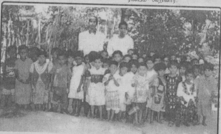
களுவாஞ்சிகுடி சமூக நலன்புரி அமைப்பால் வசதி குறைந்த மாணவர்களுக்கு நடத்தப்படும் பாலர் பாடசாலையில் மாணவர்கள்

களுவாஞ்சிகுடி நகர லயன்ஸ் கழகம் அண்மையில் களுவாஞ்சிகுடி மாணவர் அபிவிருத்திக் கழகம் நடத்தும் இலவச வகுப்புக்களில் பங்கு கொண்ட மாணவர்களுக்கு சத்துணவுப் பொருட்களை வழங்கி மாணவர்களை ஊக்கப்படுத்தியது. இதற்கு சில வாரங்களுக்கு முன்னர், அப்பியாசக் கொப்பிகள், பென்சில், பென், அரிக்கன்லாம்பு போன்ற பொருட்களை களுவாஞ்சிகுடி நகர லயன்ஸ் கழகம்