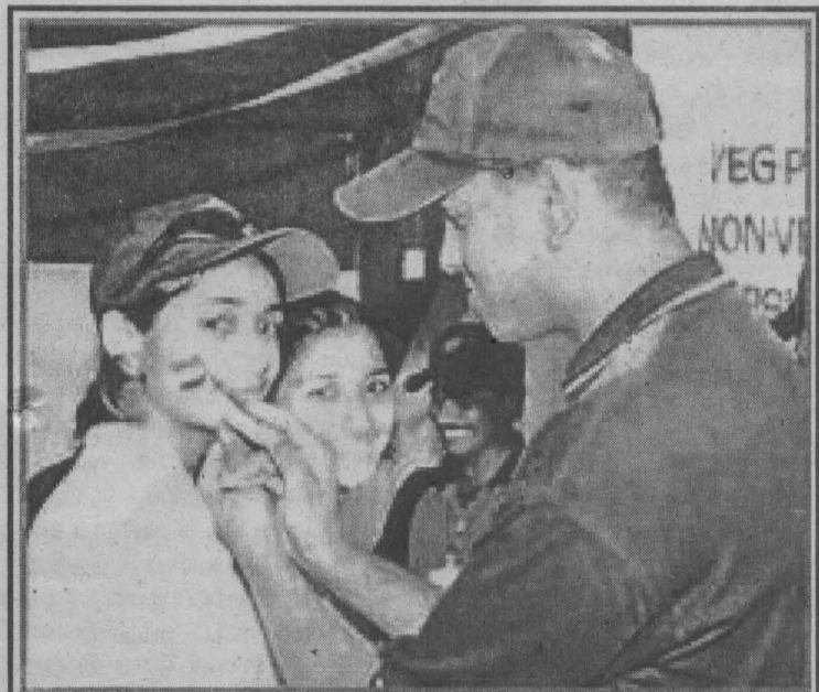
ஆஸ்திரேலியாவுடனான டெஸ்ட் போட்டியை காண வந்த இளம் ரசிகைகள் தங்கள் முகத்தில் தேசிய கொடியை ஆர்வத்துடன் வரைந்து கொண்ட காட்சி