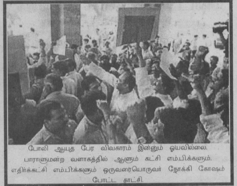
போலி ஆயுத பேர விவகாரம் இன்னும் ஓயவில்லை. பாராளுமன்ற வளாகத்தில் ஆளும் கட்சி எம்.பி.க்களும், எதிர்க்கட்சி எம்.பி.க்களும் ஒருவரையொருவர் நோக்கி கோஷம் போட்ட காட்சி.