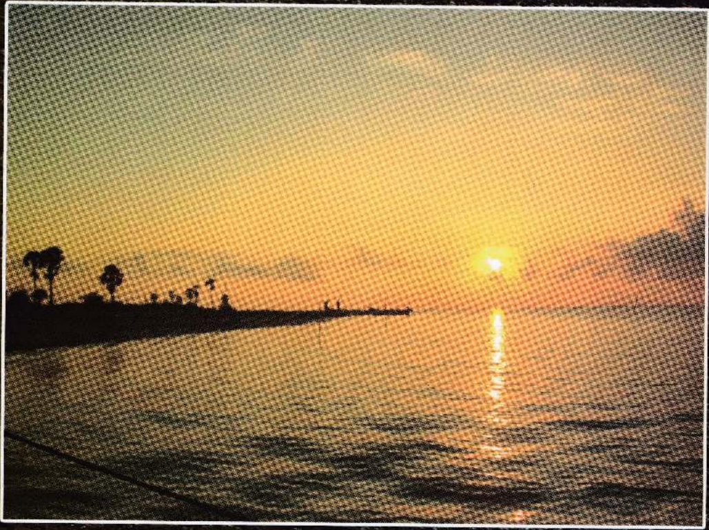
அரியாலை கிழக்கு - கடற்கரை