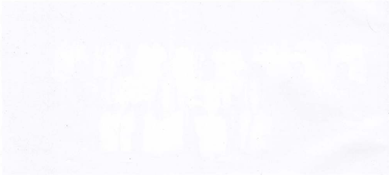
THE UNIVERSITY OF CHICAGO LIBRARY A very faint, low-contrast photograph of a group of people, possibly a choir or a group of students, standing in a line. The image is almost entirely washed out, making individual features and clothing difficult to discern. The group appears to be outdoors or in a large, open indoor space.