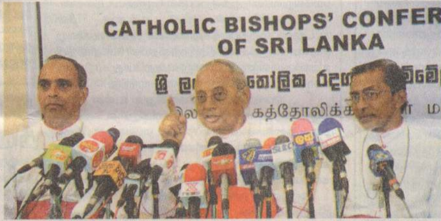
CATHOLIC BISHOPS' CONFERENCE OF SRI LANKA

இவ் ஆயர் பேரவையின் போது நாட்டின் ஜனாதிபதி உட்பட நாட்டின் அரசியல் தலைவர்களுடனும் பேரவை சந்தித்து உரையாடியது. பேரவையின் இறுதியில் ஒரு ஊடக சந்திப்பில் அறிக்கை ஒன்றும் வெளியிடப்பட்டது. இவ் அறிக்கையிலேயே மேற் கூறப்பட்ட வேண்டுகோள் அரசிடம் முன்வைக்கப்பட்டது. அவ் அறிக்கையாவது : சிலுவையில் தமது எதிரிகளையே மன்னித்த இயேசுவின் மிகச் சிறந்த முன்மாதிரி கையைப் பின்பற்றி இம் மிருகத்தனமான தாக்குதலுக்கு இலக்கான நிலையில் இறைமக்கள் நடந்துகொண்ட முறையை எல்லா ஆயர்களும் மீண்டும் பாராட்டி நிற்கின்றனர். ஒரு நாட்டின் மக்கள் என்ற முறையில் நாம் ஒருவரை ஒருவர் ஏற்றுக்கொள்ள வேண்டும். மற்றும் ஒவ்வொரு மதத்தின் தனித்துவத்தையும் மதிக்க வேண்டும். மதத்தின் பெயரில் வன்