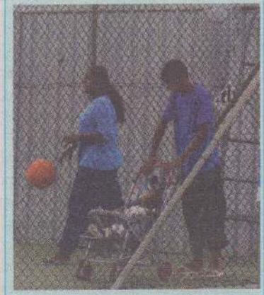
லியாவின் கிழக்கு பகுதியில் நோர்த் தாம் பகுதியில் அமைக்கப்பட்டு வரும் இந்த தடுப்பு நிலையம்