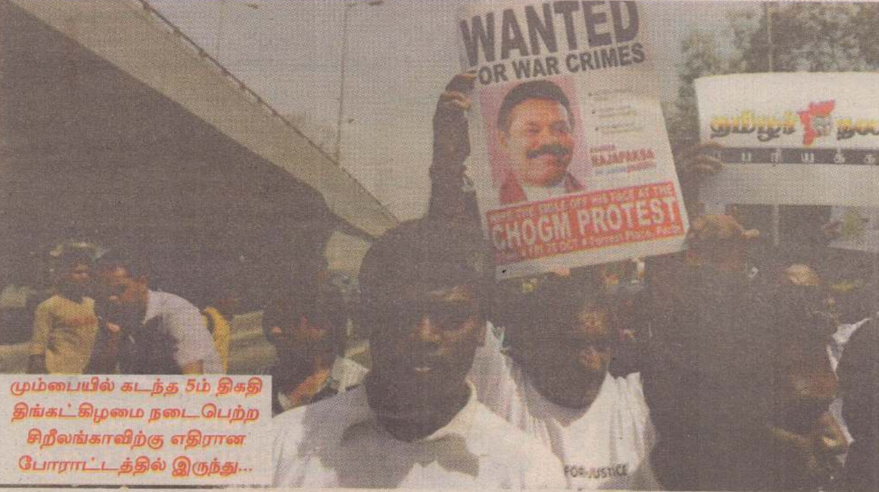
மும்பையில் கடந்த 5ம் திகதி திங்கட்கிழமை நடைபெற்ற சிறிலங்காவிற்கு எதிரான போராட்டத்தில் இருந்து...

இதுஇவ்வாறிருக்க, சிறிலங்காவிற்கு ஆதரவாக மலேசியா வாக்களிக்கவுள்ளதாக தெரிவிக்கப்படும் நிலையில், சிறிலங்கா மீது முன்வைக்கப்படும் அமெரிக்காவின் பிரேரணைக்கு ஆதரவு அளிப்பதை உறுதி செய்யும்படி மலேசிய பிரதமர் நஜிபு துன் ரஸாக்கிற்கு குறிப்பாணை ஒன்றை கடந்த வெள்ளிக் கிழமை அனுப்பி வைத்துள்ளதாக மலேசிய நாடாளுமன்ற உறுப்பினர் எம்.மனோகரன் தெரிவித்துள்ளார். மலேசியாவில் உள்ள இந்திய தமிழ் சமூகத்தின் கோரிக்கைக்கு மலேசிய பிரதமர் செவிசாய்க்க வேண்டும் என அதில் மனோகரன் கேட்டுக் கொண்டுள்ளார். அடுத்த பொதுத் தேர்தலில் இந்திய தமிழ் சமூகத்தின் ஆதரவை பரிசன் தேசிய புத்ரஜயா (Barisan Nasional Putrajaya) கட்சி பெற வேண்டுமானால் சிறிலங்கா மீதான பிரேரணையை மலேசியா ஆதரிக்க வேண்டும் என அவர் கோரிக்கை விடுத்துள்ளார். பிரேரணை நிறைவேற்றப்படுவதன் மூலம் இலங்கையிலுள்ள தமிழ், முஸ்லிம் மக்களின் பாதுகாப்பு உறுதிப்படுத்தப்படும் என அவர் சுட்டிக்காட்டியுள்ளார்.