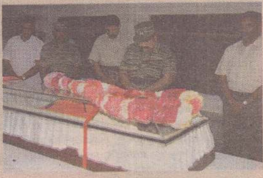
(08ம் பக்கம் பார்க்க)