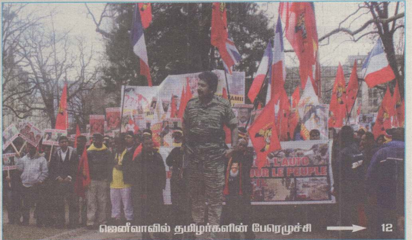
ஜெனீவாவில் தமிழர்களின் பேரெழுச்சி → 12