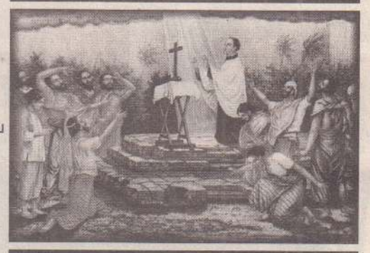
யோ. யோய் போர்சி சுன்னாகம் பங்கு

இலங்கை திருநாட்டில் எம் மக்களின் துன்பங்கள் துயரங்கள் வாழ்வின் பிரச்சினைகள் ஊடாக நாம் பயணிக்க அழைக்கப்பட்டிருக்கிறோம். புனிதர் எமக்கு விட்டுச் சென்றிருக்கின்ற அற்புதப் பயணம் தான் சிலுவைப் பயணம். பயணிப்போம் இறை அரகை நிலை நிறுத்துவோம்.