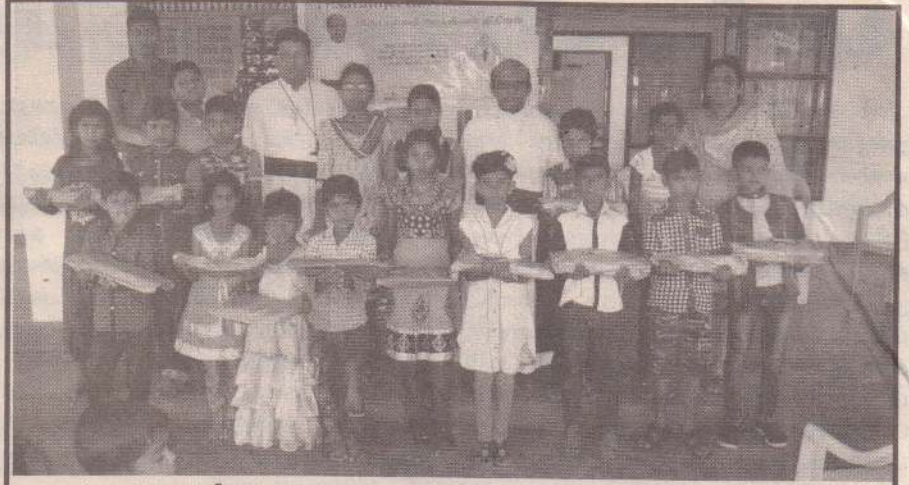
அருட்பணி சரத்ஜீவன் பவுண்டேசன் எனும் தொண்டுப்பணியின் தூரநோக்கு எமது மண்ணில் ஏற்பட்ட அனர்த்தங்களாலும், வாழ்வாதார பின்னடைவுகளாலும் பாதிக்கப்பட்ட சிறுவர்களின் கல்வியை மேம்படுத்துவதாகும். யாழ், வன்னி மாவட்டத்தில் உள்ள முல்லைத்தீவு, மல்லாவி, உருத்திரபுரம், பூநகரி, இரணைப்பாலை, யாழ்ப்பாணம் போன்ற பகுதிகளில் தேர்ந்தெடுத்த 89 மாணவர்களின் கல்விகளை உதவித்திட்டங்கள் இந்நிறுவனத்தினால் மேற்கொள்ளப்பட்டு வருகின்றது.