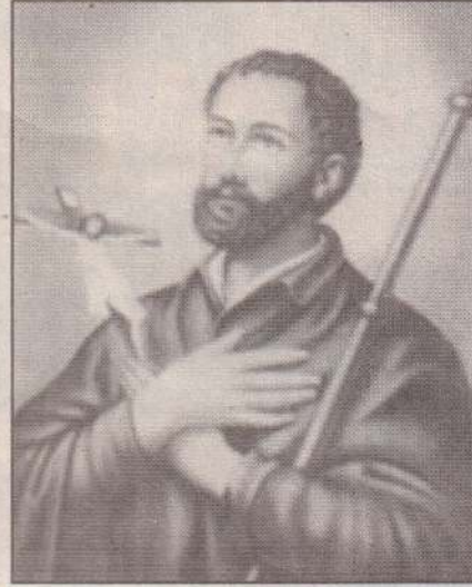
நோக்கி தன் கடற்பயணத்தை ஆரம்பித்து,

இந்தியாவின் மேற்குக் கரையான கோவா நகரை அடைந்தார். அன்று தொடக்கம் தன் 10 ஆண்டு அறுவடைப் பணியில் பரந்து சிதறி வாழும் இந்திய, மலேசிய, சீன, ஜப்பான் தேசித்து மக்களுக்கு இறை நம்பிக்கையை கூட்டலானார்.