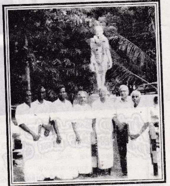
காந்தி ஜயந்தி தினத்தன்று யாழ்நகர மத்தியிலுள்ள காந்திஜீயின் உருவச்சிலைக்கு மாலை அணிவித்த பின்னர் அகில இலங்கை காந்தி சேவாசங்க நிர்வாக சபை உறுப்பினர்கள் உருவச் சிலையின் முன்னால் நின்று எடுத்த புகைப்படம்.

இலங்கையில் டொனமூர் ஆட்சிமுறைதொடங்கி மெல்ல மெல்ல உரிமைகள் மறுக்கப்பட்ட நிலையில் சட்ட ரீதியான ஒடுக்கு முறையும் ஆரம்பித்தபோது, செல்வநாயகம் அதனைச் சாத்துவிகவழியில் எதிர்த்தார். பாராளுமன்றத்தின் முகப்பில் சத்தியாக் கிரகம் போன்ற வெகுஜனப் போராட்டங்களைத் தொடங்கினார். ஆனால் தொடர்ந்து மக்கள் இயக்கமாக அதனைக்கட்டி எழுப்பத் தவறிவிட்டனர், பின் வந்த எம் அரசியல் தலைவர்கள். பாராளுமன்ற ஜனநாயக வேர்கள் இன்றி, வெஸ்ந்மின்ஸ்ரர் மாதிரியில் அரசமைப்பை மட்டும் வைத்துக் கொண்டு ‘மக்களாட்சி’ புரிந்தோர், சமய, இன, மொழி வெறியைத் தூண்டிச் சுயலாபம் பெற்ற அரசியல் வரலாறு, இறுதியில் ஆயுதப் போராட்டமாயிற்று. எம் தலைமையிலிருந்தோர் காந்திஜீயின் துறவு, தியாகம், எளிமை போன்றவற்றை இன்னும் அதிகமாகவிருத்தி செய்திருந்தால், எம் வரலாறு வேறு விதமாயிருந்திருக்கும்.