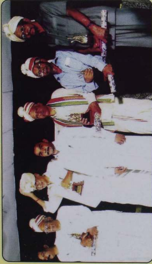
தமிழியல் வித்தகர் விருது பெற்றவர்களுடன்