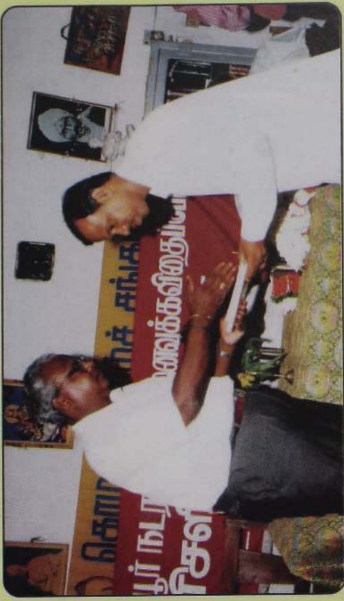
நாவுற்குழியூர் நடராஜன் கவிதைப்போட்டிப் பரிசு. இலங்கை ஒலிபரப்பு கூட்டுத்தாபன பணிப்பாளரிடமிருந்து.