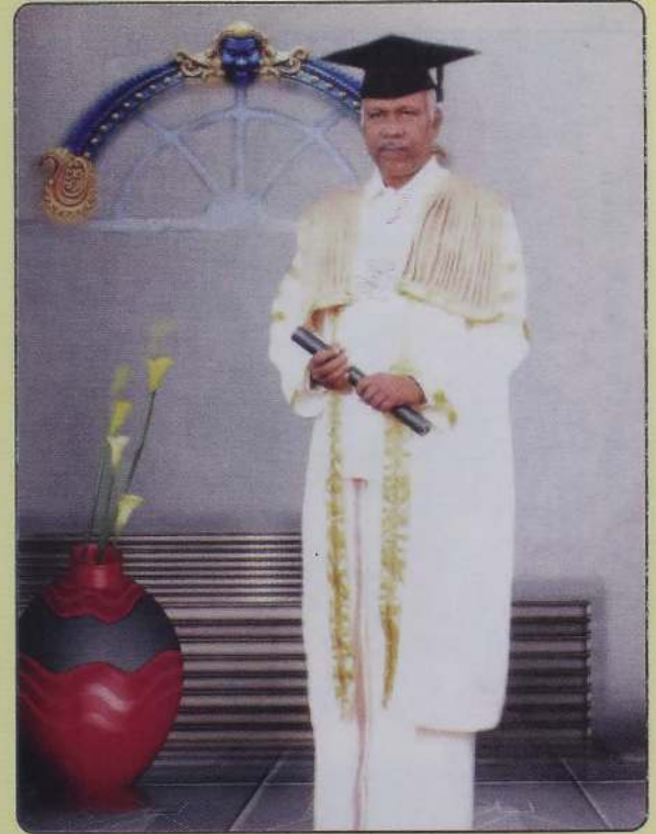
கௌரவ கலாநிதிப் பட்ட விருதுக்கான கோல உடையுள்