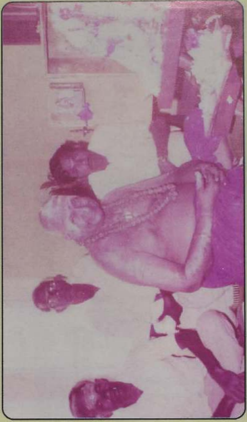
திருமருக கிருபானந்த வாரியார் சுவாமிகளுடன் - 1983