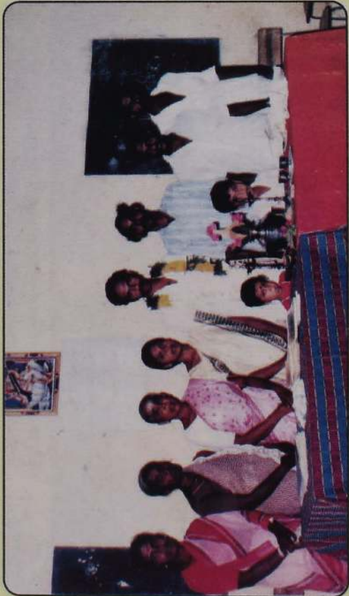
பம்பைமடு கிராமத்தில் கௌரவிக்கப்பட்ட போது -1988