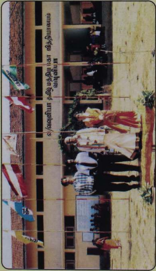
வவுனியா தமிழ் மத்திய மகா வித்தியாலம் ஆரம்பப் பரிவு விளையாட்டுப் போட்டியில்