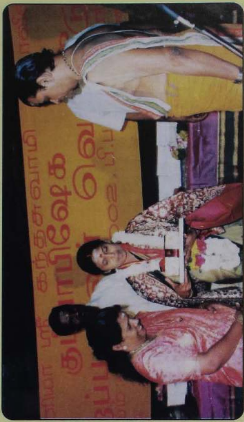
வவுனியா கந்தசாமி கோவில் சம்பாபிஷேக மலர் ஆசிரியருக்கான கொளரவத்திணை துணைவியார் பெறுகிறார். - 2002