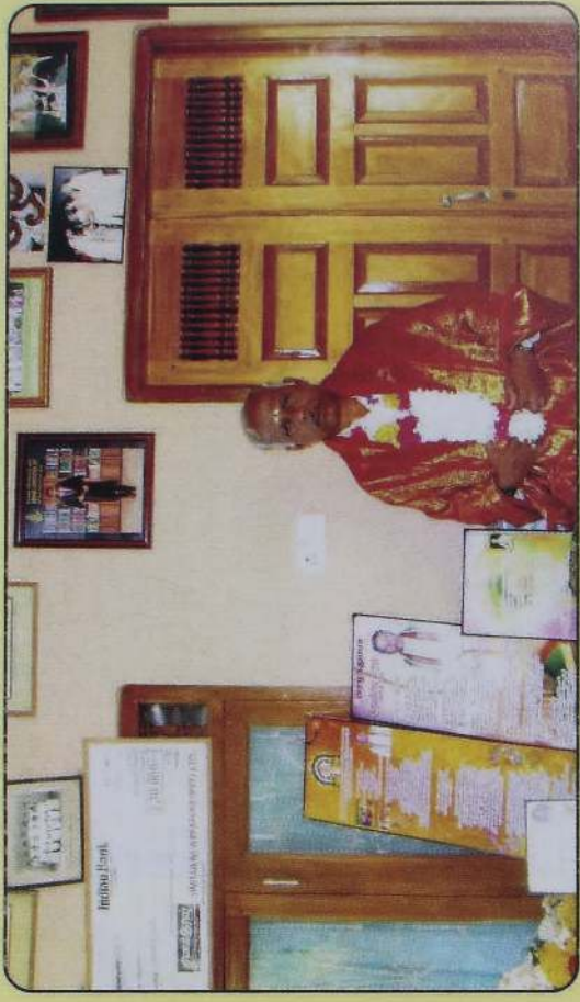
பொன்னாடை கௌரவங்களுடன் இல்லத்தில்