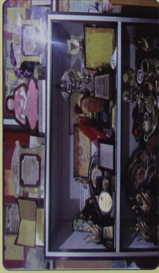
பெற்ற பரிசில்கள் சில