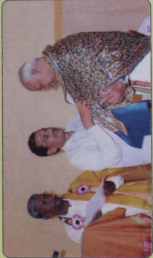
கிளிநொச்சியில் கௌரவம் பெறல்