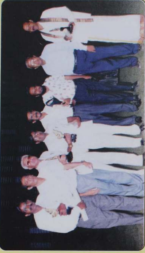
அதே விழாவில் விருது பெற்றவர்கள் மற்றும் சிலருடன் -1995