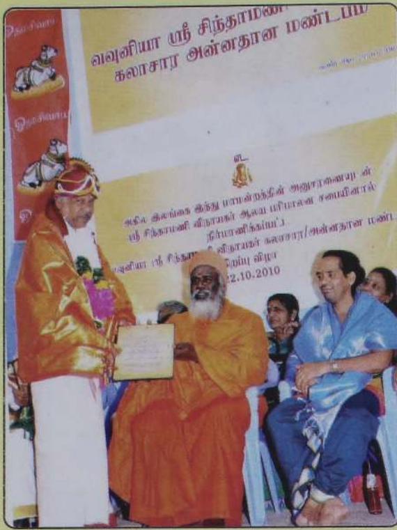
நல்லை ஆதீன முதல்வர் பட்டம் வழங்கி கௌரவிக்கிறார்