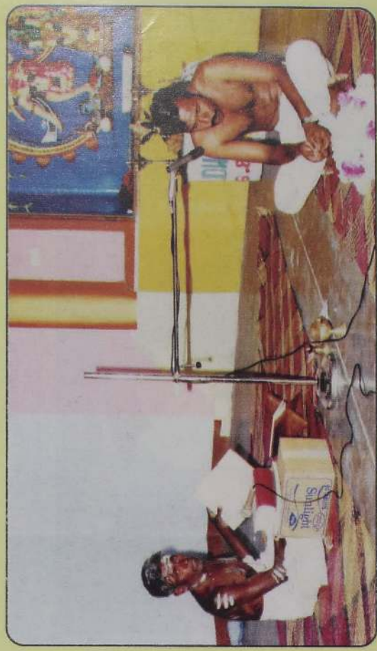
சுத்தானந்த இந்து இளைஞர் சங்கத்தின் புராண படனம்