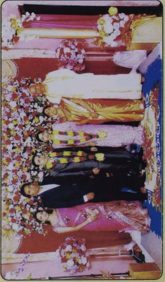
மக்கள், மருமக்களுடன் தம்பதியினர்