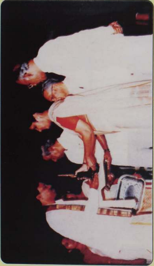
அன்றில் பறவைகள் வானொலி நாடக நூலுக்கான தேசிய சாகித்திய மண்டல விருது ஜனாதிபதி சந்திரிக்கா பண்டாரநாயக்கா குமாரதுங்கவிடமிருந்து-1995