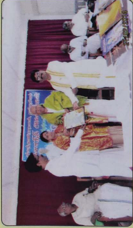
ஸ்கந்தவேதாய கல்வூரியில் நடைபெற்ற மணி விழாவில் - 2014