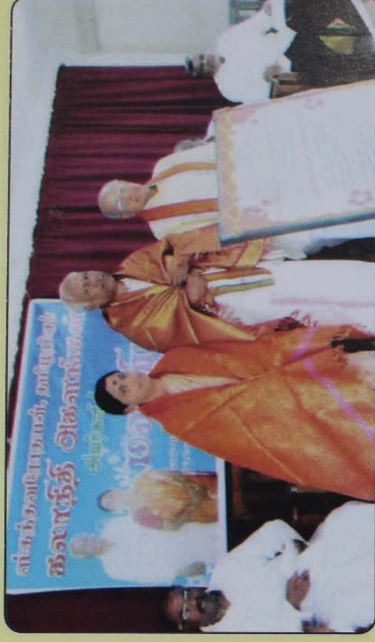
ஸ்கந்தவேதாய கல்வூரியில் நடைபெற்ற மணி விழாவில் - 2014