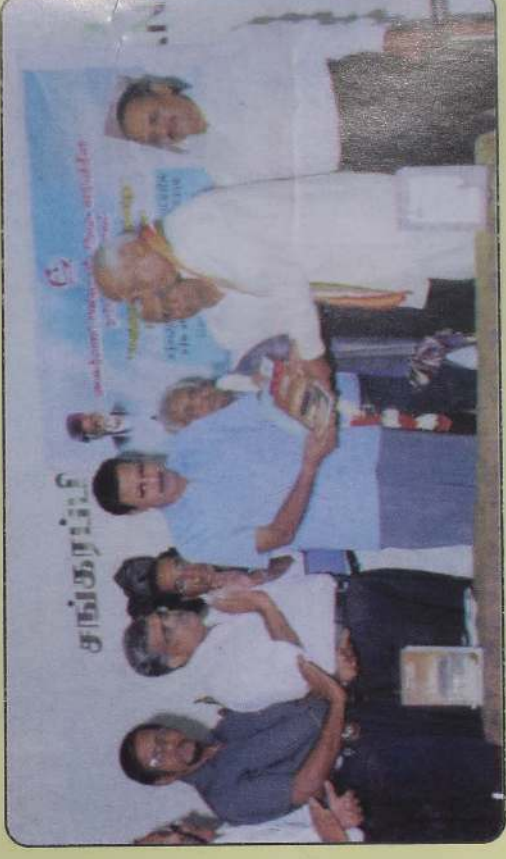
கொழும்பில் பரிசு பெறல்