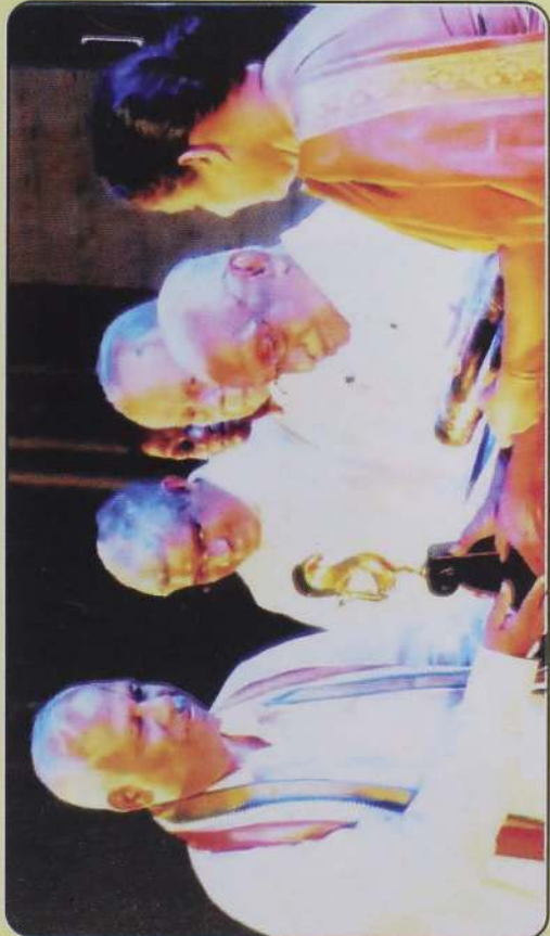
சின்னஞ்சிறிய சிறகுகள் குழந்தைப்பாடல் நூலிற்கான தேசிய சாகித்திய மண்டல விருது: கலாசார அமைச்சர் ரீ.பி.எக்கநாயக்கவிடமிருந்து -2013