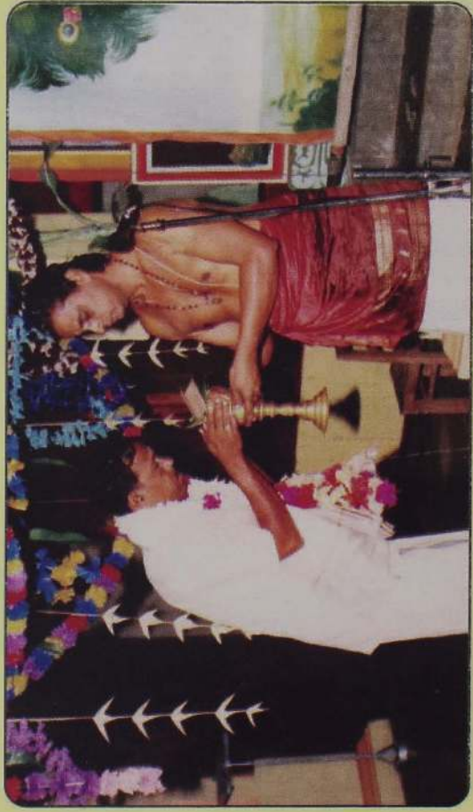
தொடர் சொற்பொழிவு இறுதியில் சிவபூர், இ. பாலசுந்திரக் குருக்களிடம் காளாஞ்சி பெறல்