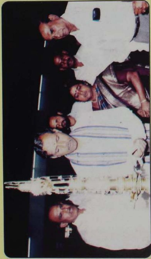
இந்து கலாசார அமைச்சின் அறநெறி விழாவில் - 1997