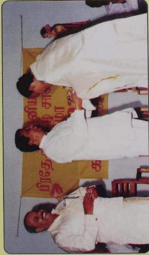
இந்து கலாசார இராஜாங்க அமைச்சர் பி.பி. தேவராஜ் அவர்களிடம் கௌரவம் பெறல். அருகில் உடுவை சி.தில்லைநடராஜர்