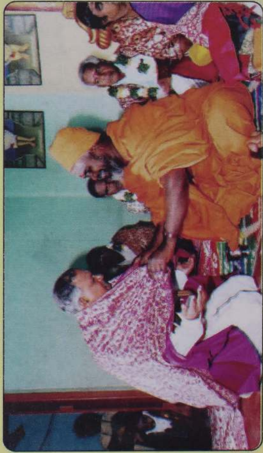
யாழ் நல்லை ஆதீன முதல்வரால் கொளரவிக்கப்படல் -2003