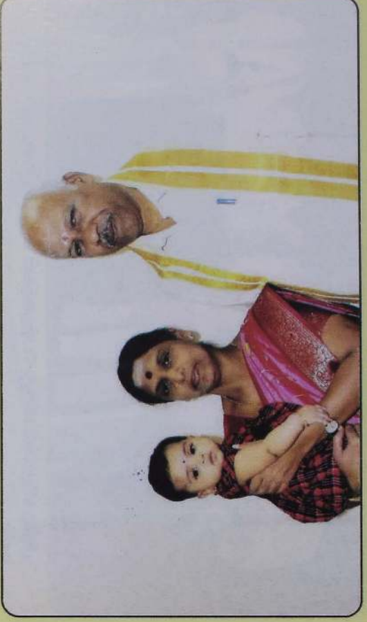
மகன் வழிப் பேத்தி ஆதிராவுடன்