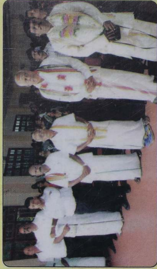
நிருத்திய நிகேதன நுண்கலைக்கல்லூரி ஆண்டு விழாவில்