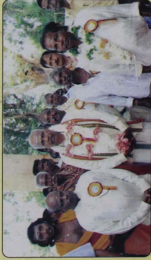
நெடுங்கேணி பிரதேச கலை இலக்கிய விழாவில்