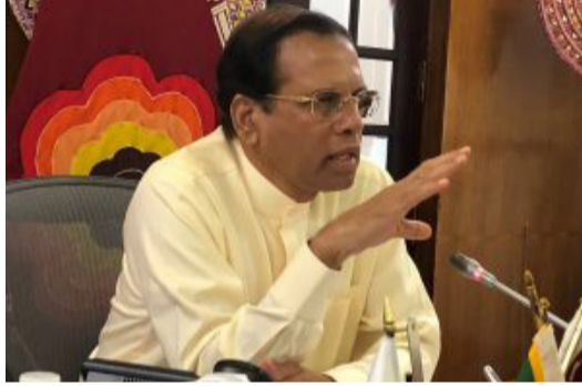
கொழும்பு, ஜூன் 18 ஜனாதிபதி மைத்திரிபால சிறிசேன இம்மாத

இறுதியில் கம்போடியாவுக்குப் பயணம் மேற்கொள்ளவுள்ளார்.