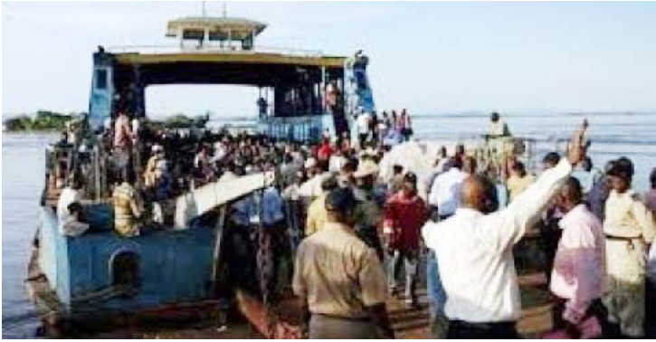
இந்த நிலையில், கடந்த சனிக்கிழமை இரவு இந்த ஏரியில் 300 இற்கும் மேற்பட்ட பயணிகளுடன் படகு ஒன்று சென்று கொண்டிருந்தது.

கொங்கோநாட்டில் ஏரியில் படகு கவிழ்ந்த விபத்தில் சிக்கி 45 பேர் பலியாயினர். மேலும் இருநூறுக்கும் அதிகமானோரைக் காணவில்லை. மத்திய ஆபிரிக்க நாடுகளில் ஒன்றான கொங்கோநாட்டின் மேற்கு பகுதியில் உள்ள மாய் நேடம்போ மாகாணத்தின் தலைநகர் இனான்கோவில் மிகப்பெரிய ஏரி ஒன்று உள்ளது. இனான்கோவில் சாலை வசதிகள் சரிவர இல்லாதமையால் பெரும்பாலான மக்கள் படகுப் போக்குவரத்தையே பிரதானமாகக் கொண்டுள்ளனர்.