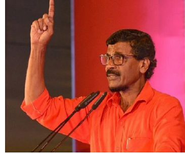
பொதுமக்களின் அச்சத்தைப் பயன்படுத்தி இனவெறியைத் தூண்டி தேர்தலில் வெற்றிபெறுவதற்கு அவர்கள் முயற்சிக்கின்றனர் - என்றார். (ஐ)

அதற்காகவே ஈஸ்டர் ஞாயிறு தாக்குதல்களைத் தொடர்ந்து இனவாதத்தைத் தூண்டும் விதத்தில் அவர்கள் கருத்து தெரிவித்து வருகின்றனர்.