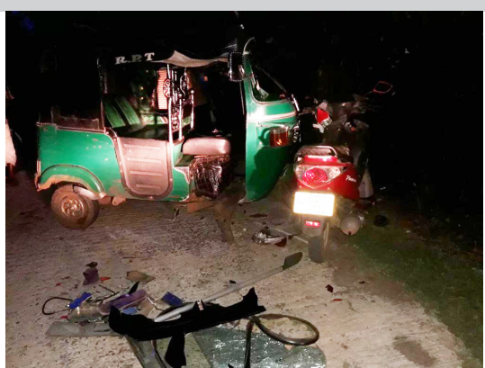
ஓட்டுசுட்டான் பொலிஸார் மேலதிக விசாரணைகளை மேற்கொண்டனர். (ஐ)