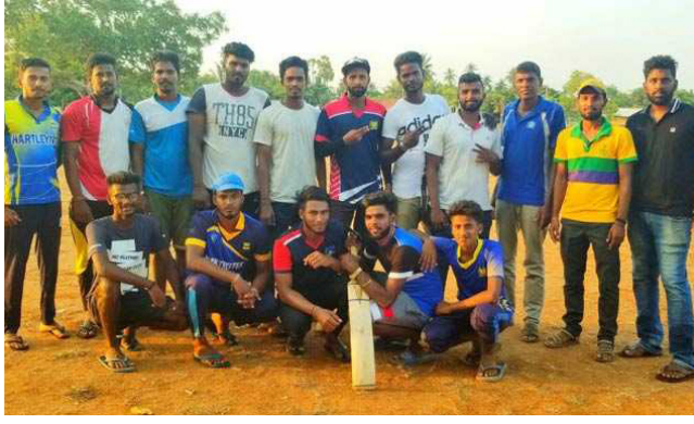
பதிலுக்கு, 75 ஓட்டங்களை வெற்றியிலக்காகக் கொண்டு துடுப்பெடுத்தாடிய உடுவில் பிரதேச செயலகம், 10 ஓவர்களில் ஏழு விக்கெட்டுகளை இழந்து 56 ஓட்டங்களைப் பெற்று 18 ஓட்டங்களால் தோல்வியடைந்தது.

10 ஓவர்கள் கொண்ட இத்தொடரில் முதலில் துடுப்பெடுத்தாடிய கரவெட்டி பிரதேச செயலகம், 10 ஓவர்களில் 74 ஓட்டங்களைப் பெற்றது. துடுப்பாட்டத்தில், அனூரதன் 28, கோகுவன் 11 ஓட்டங்களைப் பெற்றனர்.