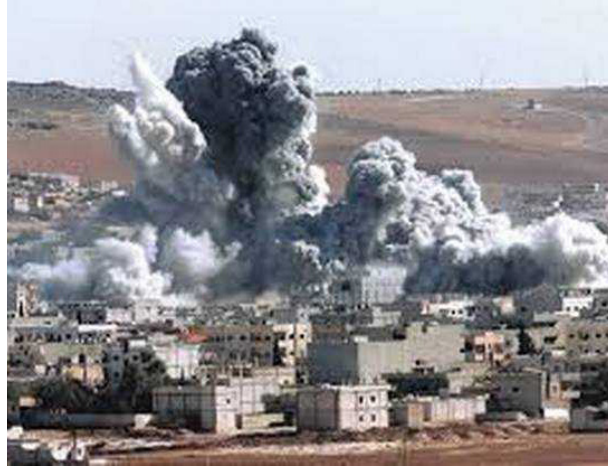
சிரியாவின் வடகிழக்குப் பகுதியில் சிரிய அரசுப் படைகள் நடத்திய தாக்குதலில் பொதுமக்கள் 21 பேர்

கொல்லப்பட்டனர். இதில் 9 பேர் குழந்தைகள். இதுகுறித்து லண்டனைத் தலைமையகமாகக் கொண்டு செயல்படும் கண்காணிப்புக் குழு, "சிரியாவில் கிளர்ச்சியாளர்கள் கட்டுப்பாட்டின் கீழ் உள்ள இடலிப் மாகாணத்தில் சிரிய அரசுப் படைகள் தொடர்ந்து தாக்குதல் நடத்தி வருகின்றன. இதில் செவ்வாய்க்கிழமை நடத்தப்பட்ட தாக்குதலில் பொதுமக்கள் 21 பேர் பலியாகினர். இதில் 9 பேர் குழந்தைகள். பலர் காயமடைந்து மருத்துவமனையில் அனுமதிக்கப்பட்டுள்ளனர்" என்று தெரிவித்துள்ளது. கடந்த சில மாதங்களாக சிரிய - ரஷ்யப் படைகள் தொடர்ந்து நடத்தி வரும் தாக்குதலில் பொதுமக்கள் 229 பேர் பலியாகி இருக்கின்றனர் எனவும், 727 பேர் காயமடைந்து இருக்கின்றனர் எனவும் ஐ.நா.சபை தெரிவித்திருந்தது. இந்நிலையில் சிரியாவில் பொதுமக்களைக் குறிவைத்துத் தொடர்ந்து தாக்குதல் நடத்தப்பட்டு வருகிறது. சிரியாவில் அதிபர் ஆசாத்துக்கும், ஐ.எஸ். தீவிரவாதிகளுக்கும் இடையே கடந்த ஆறு ஆண்டுகளாக உள் நாட்டுப் போர் நடந்து வருகிறது. இதில் ஐ.எஸ். தீவிரவாதிகளின் கட்டுப்பாட்டில் இருந்த சிரியாவின் பல்வேறு பகுதிகள் அரசு கட்டுப்பாட்டினால் மீட்கப்பட்டு விட்டன. இந்த உள்நாட்டுப் போர் காரணமாக லட்சக்கணக்கான மக்கள் அகதிகளாக அண்டை நாடுகளுக்கு இடம்பெயர்ந்தனர் என்பது குறிப்பிடத்தக்கது.