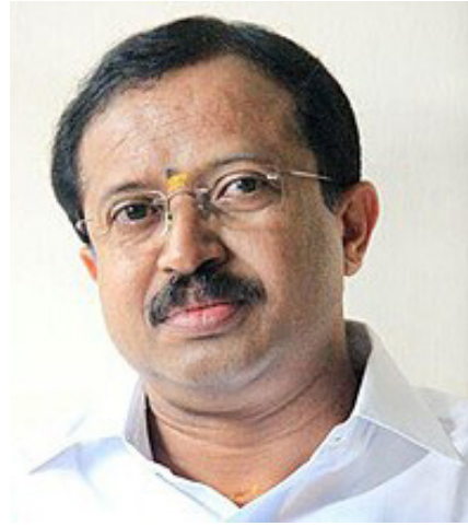
அமைதி மற்றும் கண்ணியம் ஆகிய

விரும்பங்களை தீர்க்கும் வகையில் ஒரு தீர்வு காண்பது மற்றும் தேசிய சமரசத்துக்கான நடவடிக்கையை முன்னெடுக்கும்படி இலங்கை அரசு, அரசியல் கட்சிகள், அங்குள்ள மக்கள் ஆகியோரிடமும் இந்திய அரசு தொடர்ந்து வலியுறுத்தி வருகிறது.