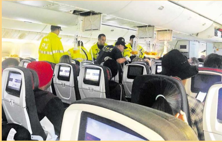
சுமார் 2 மணி நேரத்துக்கு பிறகு அமெரிக்காவின் ஹவாய் தீவுக்கு மேலே, 36 ஆயிரம் அடி உயரத்தில் அந்த விமானம்

விமானம் நடுவானில் குலுங்கியது ஏன் என்பது உடனடியாக தெரியவில்லை. இது குறித்து விசாரணை நடத்த உத்தரவிடப்பட்டு உள்ளது.