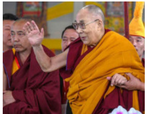
மரபு என்றும், இதில் இந்தியா தலையிடக் கூடாது என்றும் சீனா வலியுறுத்தியுள்ளது.

தலாய் லாமாவின் மறு அவதாரம் என்பது மதம், அரசியல், வரலாறு சார்ந்த 200 ஆண்டு பழமைவாய்ந்த