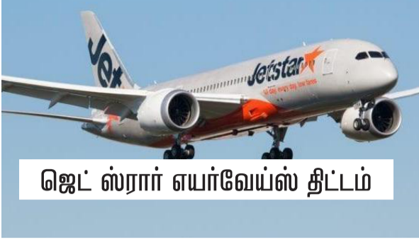
ஜெட் ஸ்ரார் எயர்வேய்ஸ் திட்டம்

ஆஸ்திரேலியாவின் மெல்பேர்ன் நகரைத் தலைமையிடமாக கொண்டிருக்கும், குறைந்த கட்டண விமான சேவை நிறுவனமான ஜெட் ஸ்ரார் எயர்வேய்ஸ் இலங்கைக்கு விரைவில் விமானங்களை இயக்கவுள்ளது.