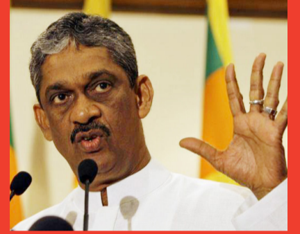
நாள். மரணதண்டனைக்கு எதிராகவே ஐக்கிய தேசியக் கட்சி உள்ளது. அதே நிலைப்பாட்டில்தான் நாங்களும் உள்ளோம் - என்றார். (ஐ)

இதேவேளை, ஜனாதிபதி மைத் திரிபால சிறிசேனவின் எதிர்வரும் ஜனா திபதித் தேர்தலில் ஸ்ரீலங்கா சுதந்திரக் கட்சியின் சார்பில் வேட்பாளராகப் போட் டியிட ஆசைப்படுகின்றார். தனக்கு வாக் குகள் தேவை என்பதற்காகச் சிறைச் சாலையில் உள்ள மனிதர்களைத் தூக்கில் போட அவர் முயற்சிக்கின்றார். மரணதண்டனைக்கு எதிராகவே ஐக்கிய தேசியக் கட்சி உள்ளது. அதே நிலைப்பாட்டில்தான் நாங்களும் உள்ளோம் - என்றார். (ஐ)