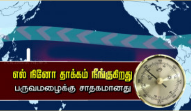
எல் நினோ தாக்கம் நீங்குகிறது பருவமழைக்கு சாதகமானது

பூமிப்பந்தின், பெரும்பான்மை பரப்பை ஐம்பெருங்கடல்கள்தான் சூழ்ந்திருக்கின்றன. எனவே, நிலப்பரப்பில் நிலவுகின்ற, தட்பவெப்ப மாற்றங்களுக்கும், கடல்களுக்கும் மிக நெருங்