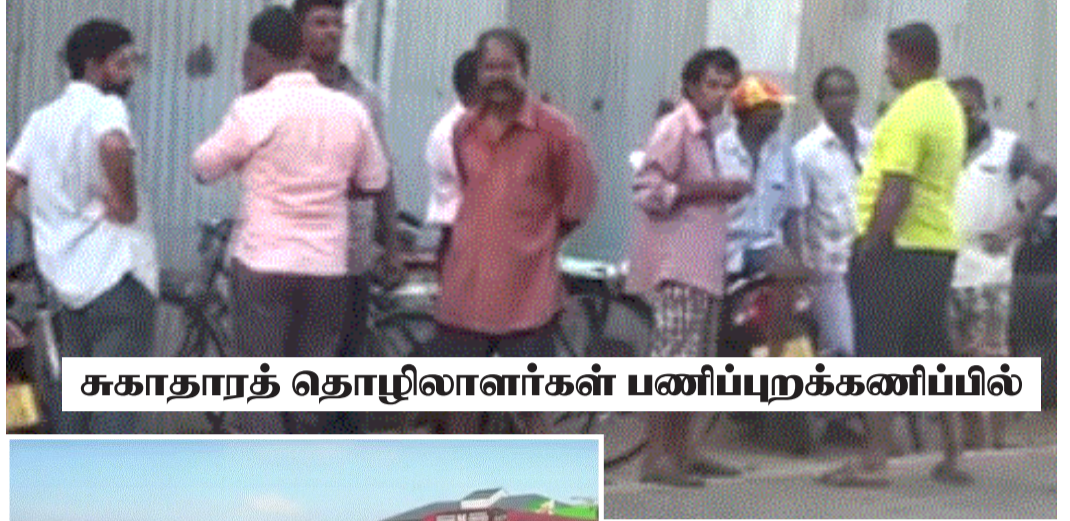
சுகாதாரத் தொழிலாளர்கள் பணிப்புறக்கணிப்பில்

இதனால் யாழ்ப்பாணம் மாநகர கழிவுகற்றல் செயற்பாடுகள் முடங்கிப் போயுள்ளன. (ஐ - 07)