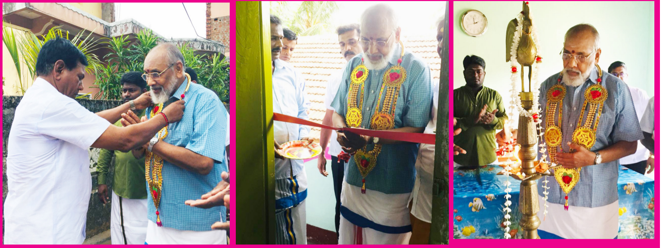
மட்டக்களப்பில் தமிழ் மக்கள் கூட்டணிக்கு மக்கள் தொடர்பு பணிமனை ஒன்றை அதன் செயலாளர் நாயகம் நீதியரசர் விக்கினேஸ்வரன் திறந்து வைத்த போது....