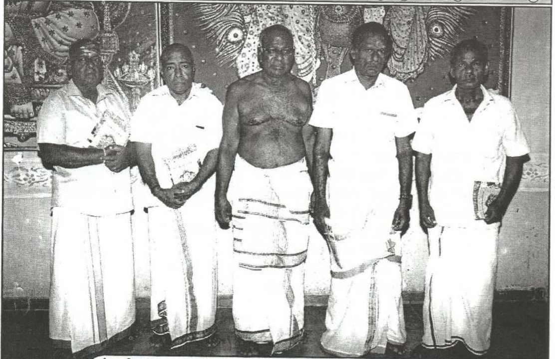
பங்குனி மாத ஞானசீகடர் மலரின் சிறப்புப்பிரதி பெற்றோரிற் சிலர்...