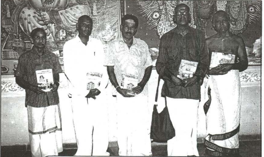
பங்குனி மாத ஞானசீகடர் மலரின் சிறப்புப்பிரதி பெற்றோரிற் சிலர்...