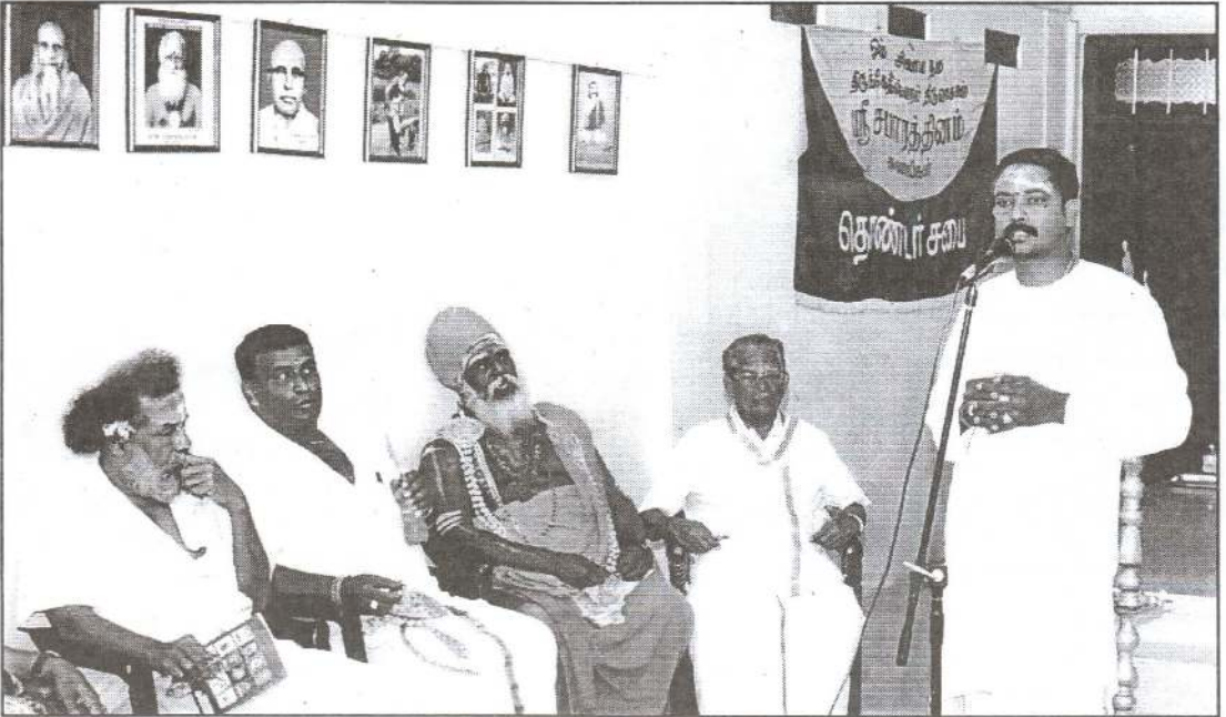
தூய்மையான இதயம் இருப்பவன் இறைவன் சந்நிதியை அடையலாம்.

“மெய்வுத்தம் பாரர் பசிநோக்கார் கன்துஞ்சார், எவ்வெவர் தீமையும் மேற்கொள்ளார் செவ்வி, அருமையும் பாரர் அவமதிப்பும் கொள்ளார், கருமே கண்ணாயினர்”