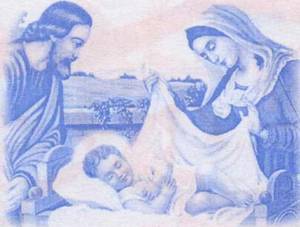
Sr.M.Milred Holy Family Convent (Mirusuvil)

ஆம் இறைவன் தன் ஒரே மகனை இவ்வுலகிற்கு ஏன்? எதற்காக? கொடுத்தார்? மனித சமுதாயத்தை பாவத்தளையிலிருந்து பாதுகாத்து மீட்டெடுக்கவே.