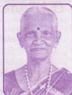
தருமத் மரிய மாசர்ல்லா மலர் மரியரட்சாம் (மலர் ரீச்சர்)