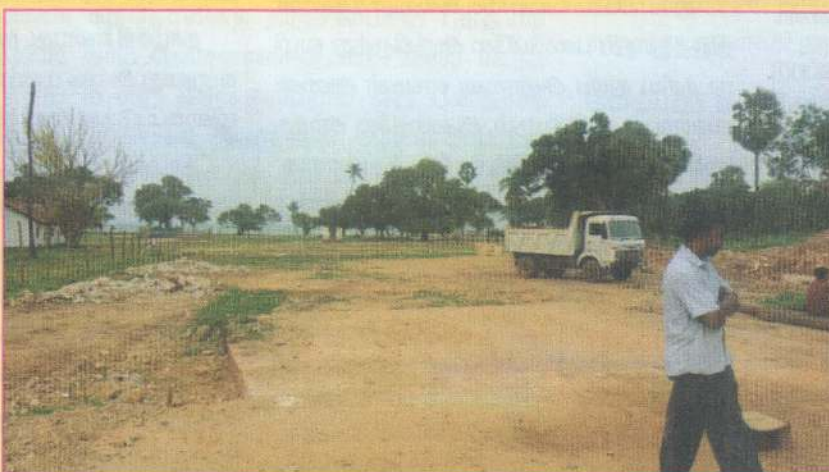
இராணுவத்தினரால் அண்மையில் விடுவிக்கப்பட்ட ஊறணியில் புனித அந்தோனியார் ஆலயம் காணப்பட்ட இடம்