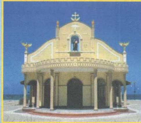
கச்சதீவில் டிசம்பர் 23ம் திகதி திறக்கப்பட்ட புனித அந்தோனியார் ஆலயம்.