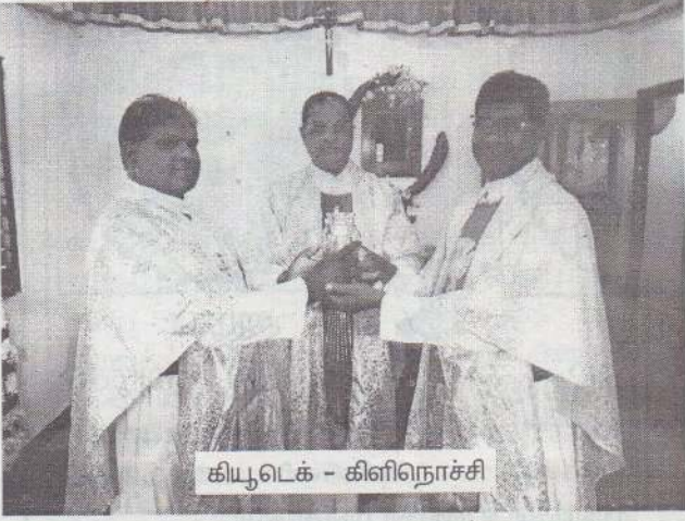
கியூடெக் - கிளிநொச்சி