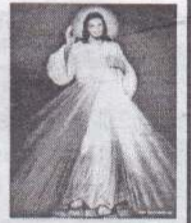
இறைதியானக் குழுவின் யாழ். மறைமாவட்டம்

மார்ச் 29 புதன் - மாலை 5.00 மணிமுதல் 8.00 மணி வரை யாழ். மரியன்னை பேராலய வளாகம், யாழ்ப்பாணம்.