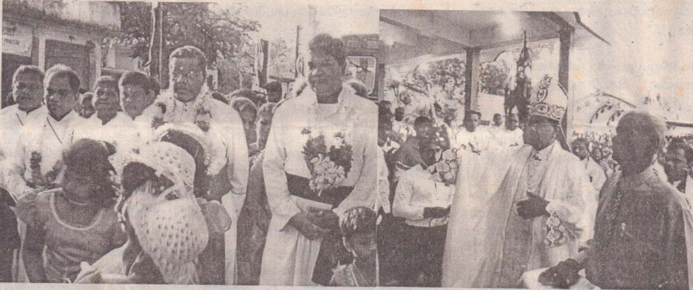
அளவற்ற ஆசீர்வாதம் நிறைந்த ஒரு அருள்பெற்ற ஆண்டாக இந்த ஆண்டு அமைகிறது