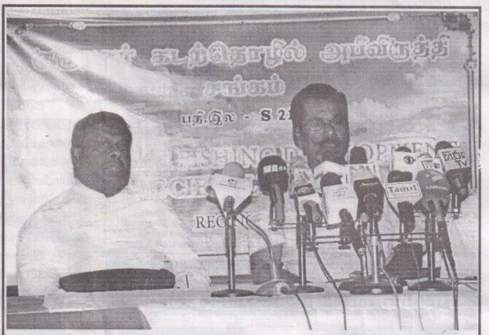
இழுவை மடித்தொழிலை முற்றிலும் தடைசெய்ய பாராளுமன்றத்தில் வரவிருக்கும் சட்டமூலத்திற்கு ஆட்சேபம் தெரிவித்து அதில் திருத்தங்களைக் கோரி குருநகர் கடந்தொழில் அபிவிருத்திச் சங்கத்தினால் உடக சந்திப்பு ஒன்று ஏற்பாடு செய்யப்பட்டது.