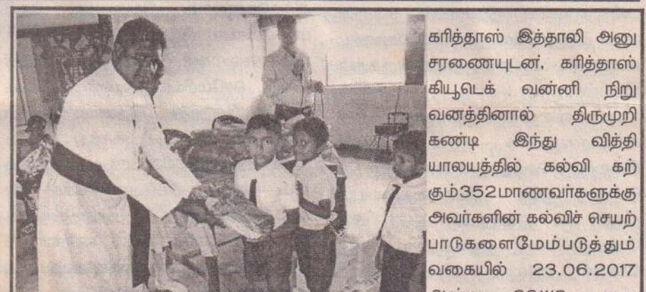
பெறுமதியான கற்றல் உபகரணங்களும் 393370 ரூபா பெறுமதியான பாதணிகளும் (சப்பாத்துகள்) வழங்கப்பட்டன.