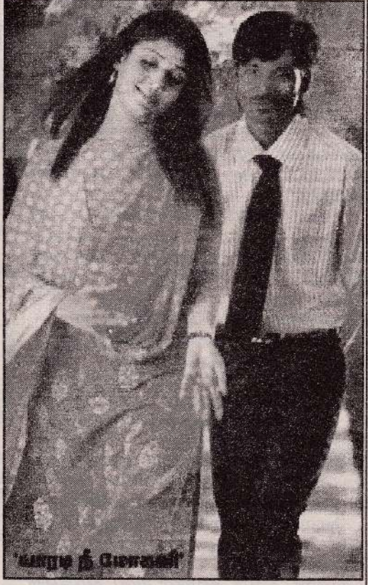
யாரடி நீ மோகினி

தமிழ் சினிமாவில் இருதுருவங்களாக இருப்பவர்கள் சிம்புவும் தனுஷும் தான். தென்னை மரத்தில் தேன் தடவினால், பனை மரத்தில் எறும்பு மொய்க்கும் என்பது நயன்தாராவுக்கு தெரியாதா என்ன? இப்படி ஒரு ஏடாகூடமான கணக்கில்தான் தனுஷுக்கு முத்தம் கொடுத்திருக்கிறாராம். ஆனால் ஒன்று, தனுஷிடம் கொடுக்கிற முத்தம் லாக்கரில் வைத்த மாதிரி பத்திரமாக இருக்கும். இதுவே சிம்புவுக்கு கொடுத்தால் போஸ்டராசிபொலிஸ் வரைக்கும் போகும்!