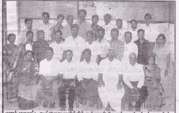
யாழ்.மாவட்ட கூட்டுறவு பயிற்சி கல்லூரியினால் நடத்தப்பட்ட கனிவூட்டிய கூட்டுறவுப் பணியாளர்களுக்கான கற்கை நெறியினை பூர்த்தி செய்த மாணவர்களையும் கல்லூரி அதிபர், விரிவுரையாளர்கள், யாழ்.மா.கூ.ச.தலைவர் ஆகியோரையும் படத்தில் காணலாம்.

ஆகவே, முன்கூறிய முறையில் வயிற்றுப் பூச்சிகள் அகற்றப்பட்டு சுத்தமாக உடல் இருந்தால், உண்ணும் உணவு மிதமாக இருந்தாலும் பூரண வளர்ச்சியடைந்து, மேலும் நோய்கள் எதுவும் அணுகாமலும் வளமோடு வாழ்க்கையினை நடத்த முடியும்.