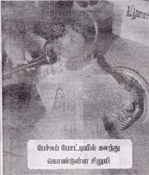
பேச்சுப் போட்டியில் கலந்து கொண்டள்ள சிறுமி