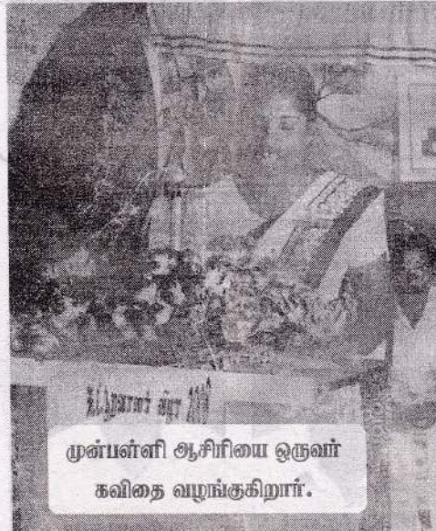
முன்பள்ளி ஆசிரியை ஒருவர் கவிதை வழங்குகிறார்.