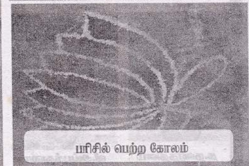
யரிசில் வழற்ற கோலம்