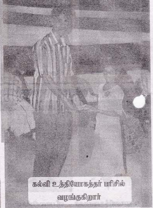
கல்வி உத்தியோகத்தர் யரிசில் வழங்குகிறார்