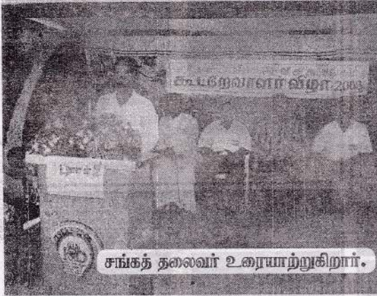
சங்கத் தலைவர் உரையாற்றுகிறார்.