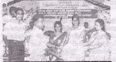
கன்னாகம் ப.தெ.வ.அ.கூ.சங்கத்திற்கு பாண்ட் வாத்திய கருவிகளை சண்டலிப்பாய் உதவி பிரதேச செயலர் வழங்குகறார்.