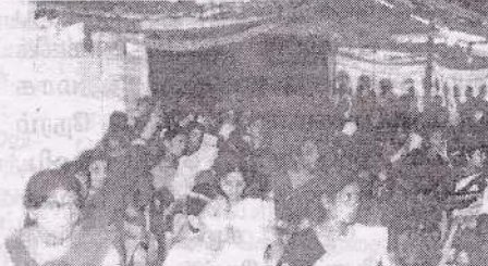
நிகழ்வில் கலந்துகொண்ட முன்பள்ளி ஆசிரியர்கள் மற்றும் கூட்டுவாளர்கள்.