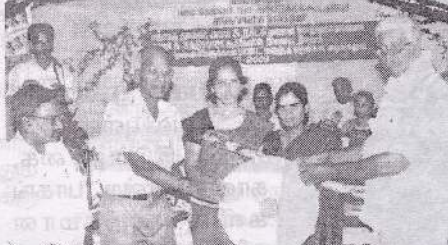
பண்டத்தரிப்பு ப.தெ.வ.அ.கூ.சங்கத்திற்கு பாண்ட் வாத்திய கருவிகளை கூ.ச.பைத் தலைவர் வழங்குகறார்.