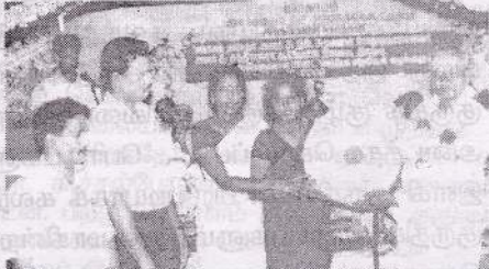
மாண்புபாய் ப.தெ.வ.அ.கூ.சங்கத்திற்கு பாண்ட் வாத்திய கருவிகளை முன்னாள் தலைவர் வழங்குகறார்.