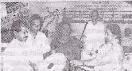
சங்காணை ப.தெ.வ.அ.கூ.சங்கத்திற்கு பாண்ட் வாத்திய கருவிகளை சண்டலிப்பாய் உதவி பிரதேச செயலர் வழங்குகறார்.