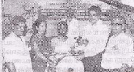
தெல்லிப்பணை ப.தெ.வ.அ.கூ.சங்கத்திற்கு பாண்ட் வாத்திய கருவிகளை யாழ்.கூட்டுவு அபிவிருத்தி உதவி ஆணையாளர் வழங்குகறார்.