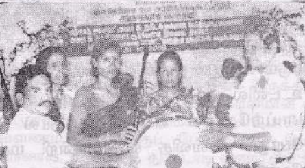
காரைநகர் ப.தெ.வ.அ.கூ.சங்கத்திற்கு பாண்ட் வாத்திய கருவிகளை சமாச பொதுமுகாமையாளர் வழங்குகறார்.