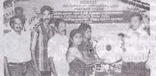
கோண்பாவில் ப.தெ.வ.அ.கூ.சங்கத்திற்கு பாண்ட் வாத்திய கருவிகளை கூட்டுவு அலுவலர் வழங்குகறார்.