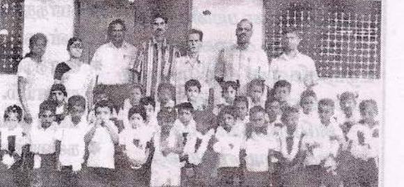
இணுவில் கலாஜோதி முன்பள்ளி மாணவர்களின் சிறுவர் தின நிகழ்வில் சிறார்கள், ஆழியர்கள், நிர்வாகிகள்