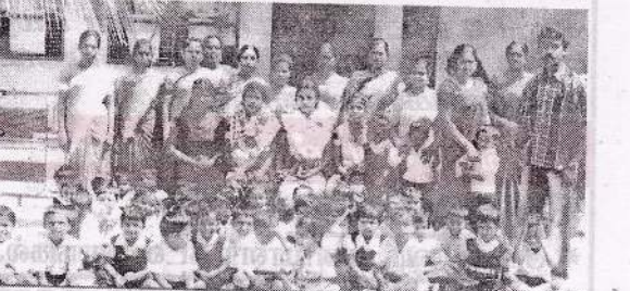
தாவடி ஸ்ரீகாந்தி அம்பாள் முன்பள்ளி ஆசிரியைகள் கௌரவிப்பு.