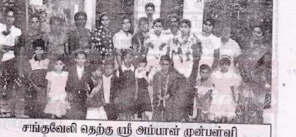
சங்குவேலி தெற்கு ஸ்ரீ அம்பாள் முன்பள்ளி ஆசிரியைகள் கௌரவிப்பு