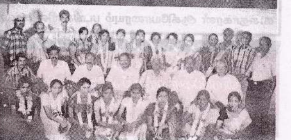
ஆசிரியர்தின விழாவில் ஆசிரியைகளும், சங்கப் பணியாளர்களும், நிர்வாகசபை உறுப்பினர்களும்