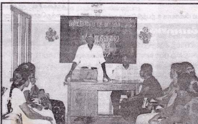
பண்டத்தரிப்பு ப.தெ.வ. அ.கூ. சங்கம், UNDP அனுசரணையுடனும் பனை அபிவிருத்திச் சபையின் ஒத்துழைப்புடனும் நடத்திவரும் பள்ளவேலை பயிற்சி ஆரம்ப நிகழ்வில் சங்கத்தின் பொது முகாமையாளர் உரையாற்றுவதையும், பனை அபிவிருத்திச் சபையின் கல்வி விரிவாக்கம் அலுவலரையும் பயிற்சி பெறும் மாணவிகளையும் படத்தில் காணலாம்.