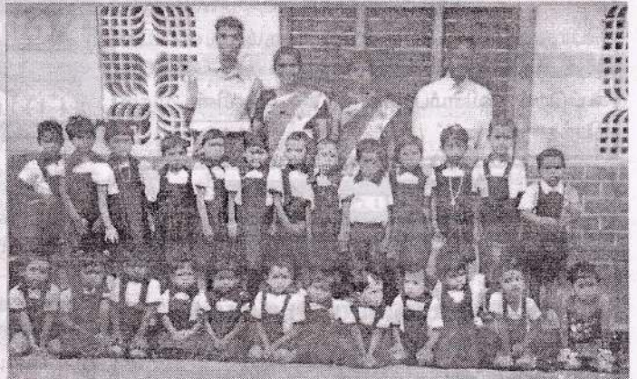
சங்கானை ப.தெ.வ.அ.கூ.சங்கத்தின் அனுசரணையுடன் இயங்கி வரும் பல்சகட்டி காந்திச் முன்பள்ளி நிலையத்தினரின் பிரிவு உபசார விழாவின்போது பங்குபற்றிய மாணவர்கள், ஆசிரியர்கள், நிலைய நிர்வாகிகள் ஆகியோர் படத்தில் காணப்படுகின்றார்கள்.