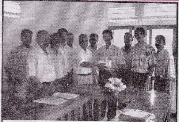
வடமாகாண ப.தெ.வ.அ.கூ.சங்கங்களின் சமாசத்தின் சமூக கல்வி அபிவிருத்தி திட்டத்தின் கீழ் வலிகாமம் கொத்தணியின் கல்வி உத்தியோகத்தரிடம் சமாச வெளிக்கள உத்தியோகத்தர் ஆ.செம்பொற்சோதி பாடசாலை உபகரணங்கள் அடங்கிய பொதியை வழங்குவதையும் சங்கங்களின், சமாச கல்வி உத்தியோகத்தர்களுக்கும் படத்தில் காணலாம்.

கூட்டுறவுத்துறையை நவீனமயப்படுத்தி மக்களுக்கு நன்மைபயக்கக் கூடிய ஒரு துறையாக மாற்றி அமைக்கப்படவேண்டியது காலத்தின் தேவையாக உள்ளது. நேரகாலம், விடுமுறை தினங்கள்