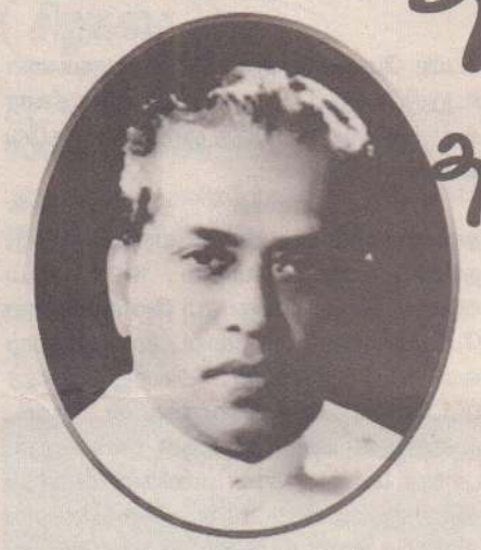
மலேசியாவில் பணி புரி

தமிழிலும், ஆங்கிலத்திலும் பல ஆய்வுக் கட்டுரைகளையும், நூல்களையும் எழுதி வெளியிட்டார். "தமிழ்த்தாது" என்ற நூல் அடங்கலாக மொத்தம் 137 நூல்களை எழுதினார்.