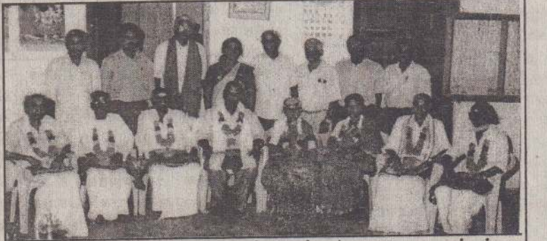
கூட்டுறவு மாதத்தையொட்டி நல்லூர் பல.நோ.கூ.சங்கத்தை வளர்த்தெடுத்த பழம்பெரும் கூட்டுறவாளர்களை மலர்மாலை அணிவித்து கௌரவிக்கப்பட்டிருப்பதை படத்தில் காணலாம்.

முதலாம் இடம்: சுதுமலையுவசக்தி - மானிப்பாய் ப.தெ.வ.அ.கூ.சங்கம். இரண்டாம் இடம்: நாமகள் - கட்டைவேலி - நெல்லியடி MPS மூன்றாம் இடம்: புலவர் முன்பள்ளி - மானிப்பாய் நான்காம் இடம்: நக்கீரன் முன்பள்ளி - பருத்தித்துறை ஐந்தாம் இடம்: வெள்ளாம்போக்கட்டி - கொடிகாமம்.