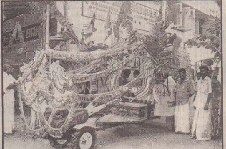
கிரண்டாவது உலக கிந்துமாநாட்டை முன்னிட்டு கட்டைவேலி நெல்லியடி ப.நோ.கூ.சங்கம் ஏற்பாடுசெய்திருந்த ஊர்தி பவணிவருமுன் சங்க பணியாளர்கள் சகீதம் எடுக்கப்பட்ட படம்.

நாட்டு மக்களின் நிவாரணப்பொருள் விநியோகத்துக்கு உளநூரில் இருந்து தேவையான அரிசியை பல நோக்குக் கூட்டுறவு சங்கங்கள் நேரடியாக கொள்வனவு செய்ய யாழ் அரச அதிபர் அனுமதி வழங்கியிருந்தமை குறிப்பிடத்தக்கது.