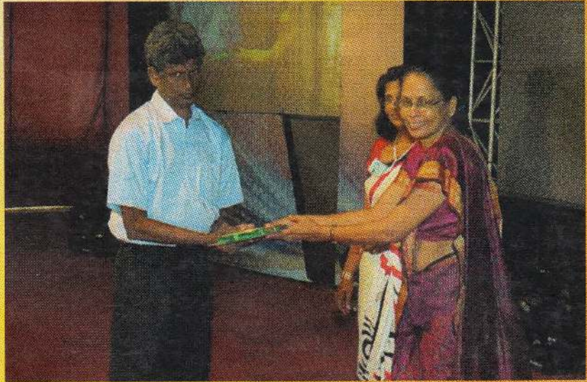
2012 இல் தேசிய விஞ்ஞான விருது பெற்ற போது நூலாசிரியர்