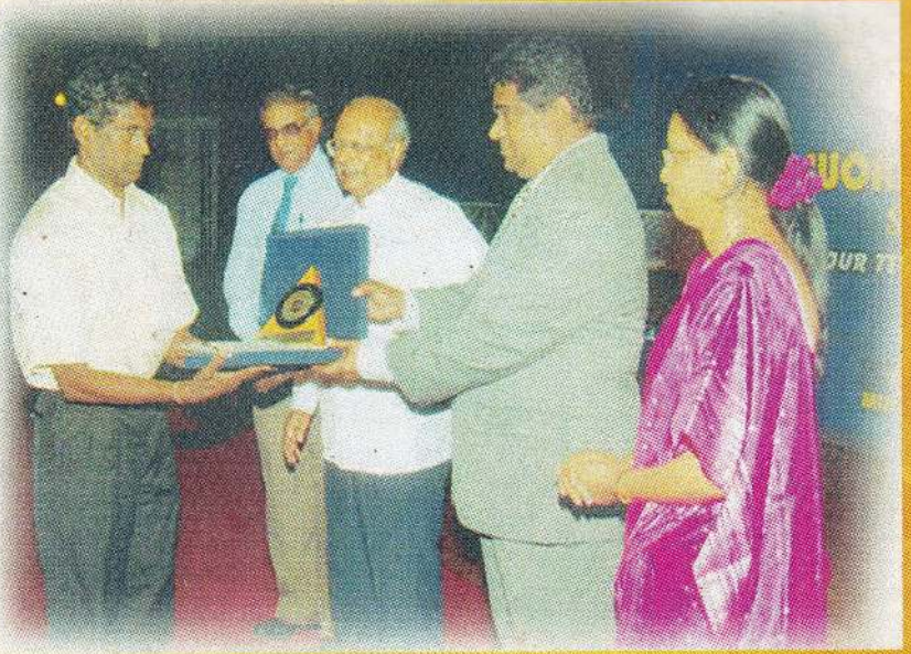
2007 இல் விஞ்ஞான ஆசிரியர்க்கான தேசிய விருது பெற்ற போது நூலாசிரியர்