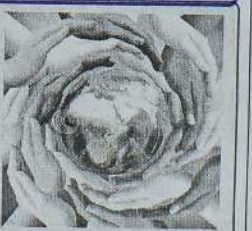
பொது வழிபாடு இடம் பெறுவது.