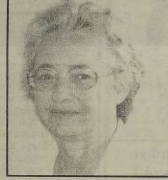
அருட்சகோதரி. மாக்ரேற் முல்சூன் இன்றைய சபாபத்தவள்