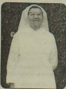
அருட்சகோதரி. யோசேப்பின்ரைனன் யாழ் - மடம் அறுதியான அதிபர்