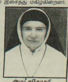
அருட்சகோதரி. கொன்செப்ஷன் நவசந்நியாசத்தலைவி 34 வருடங்கள்