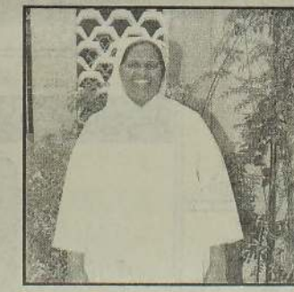
அருட்சகோதரி. யோலன்ட் மத்தியால் இன்றைய யாழ் மாகாணத் தலைவள்