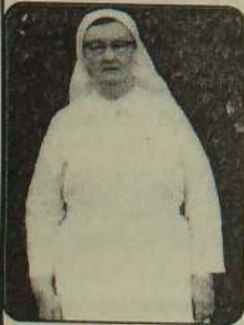
அருட்சகோதரி. வீசுந்ரேஷன் 12 வருடங்களாக யாழ் - மாகாணத் தலைவி