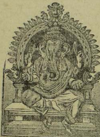
விராயக வரூபிற் பிறங்குவான மயர்வடிய வர்க்கேற்றமொரு மருப்பான விநாயகனை வணங்குவாமால் - (குதசங்கிதை)

சையமகனைச் சங்கரிப்பதற்காக முரித ஒரு கொம்பை ஏந்திபது மும்மல்களை சீக்குபவர் தாம் என்பதைக் காட்டுதற்காகம். உரிக்களைப் பாசிக்கும் ஆணவமலமசிய பாணைப் பாசத்தாற் டேடி அங்குசத்தால் அடக்கி, மறைத்த லெண்டும் கருணைபுரிபவர் தாம் என்பதை அறிவித்தற்காகப் பாசா லு கு சங்களை ஏந்தினார். ஆணவத்தைப் போக்கி உரிசை ஆட்கொள்பவர் என்பது ஆணவ சொருபுகைய சய முகனைப் பாசக் கயிற்றூற கட்டி, அங்குசத்தால் அடக்கி, அவன் மலத்தை நீக்கிச் சுத்தஞ்சி அவனைத் தமக்கு வரகன மாக்கிக் கொண்டு பெரும் பேற்றை அளித்தார் என்பதால் போதரும். இவருடைய துறிகை வித்தராத தத்துவத்தைக் குறிப்பித்த இவரது ஞான சொருபத்தை அறிவிக்கின்றது. அடியார்கள் பசுஞானத்தைக் கவனமாக ஒப்பிக்க, அதனை உண்டு தமது பேசுமலயிற்றில் தறுத்திச் சிவஞானத்தைக் கொடுப்பவர் தாம் என்பதை உணர்த்தும் பொருட்டுக் கவன உணவாசிய மோதகத்தை ஓர் கையிற் கொண்டார். உள்ளமெனும் கூடத்தி லுக்கமெனும்