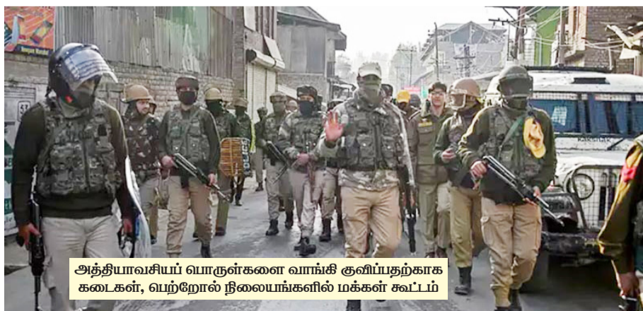
அத்தியாவசியப் பொருள்களை வாங்கி குவிப்பதற்காக கடைகள், பெற்றோல் நிலையங்களில் மக்கள் கூட்டம்

அதைத் தொடர்ந்துதான், இந்த மாதம் 15 ஆம் திகதி நிறைவு அடைய இருந்த அமர்நாத் யாத்திரையை உடனே முடித்