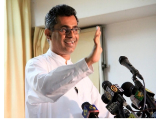
கொழும்பு, ஓக. 05 புதிய கூட்டமைப்பை உருவாக்கும் முயற்சிகள் தொடர்ந்தும் கலந்துரையாடல் மட்டத்திலேயே உள்ளன என்றும் இன்னும் அது