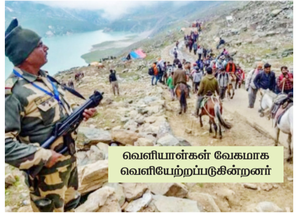
வெளியாளர்கள் வேகமாக வெளியேற்றப்படுகின்றனர்

இந்தச் சந்திப்பைத் தொடர்ந்து உமர் அப்துல்லா நிருபர்களுக்கு பேட்டி அளித்தார். அப்போது அவர், அரசியல் சாசன சட்டம் பிரிவு 370 மற்றும் 35 - ஏ ஆகிய வற்றை ரத்து செய்வதற்கான எந்த திட்டமும் இல்லை. இதே போன்று மாநிலத்தை மூன்றாக பிரிக்கவும் எந்த யோசனையும் இல்லை என்று ஆளுநர் உறுதி அளித்தார். ஆனால் காஷ்மீரைப் பொறுத்தமட்டில்