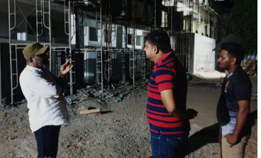
கிளிநொச்சி, ஓக. 07 வடக்கு மாகாண சபையின்