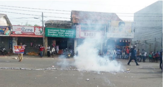
யாழ்ப்பாணம், ஓக. 10 ஸ்ரீலங்கா பொதுஜன பெரமுனவின் ஜனாதிபதி வேட்பாளராக கோட்டாபய ராஜ பக்கம் 11 >>>