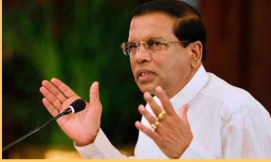
சிறப்புரிமைகளை வழங்குவது பற்றி ஆராயப் பட்டு வருவதாக மேலும் அறியமுடிந்தது. (ஐ)

மைத்திரிபால சிறிசேன ஜனாதிபதி பதவியில் இல்லாத சமயத்தில் எதிர்காலத்தில் அவருக்கு விசேட