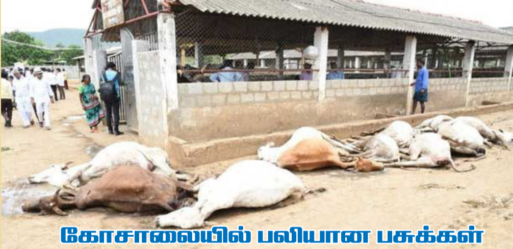
கோசாலையில் பலியான பசுக்கள்

விஜயவாடா, ஓக.12 கோட்டுரு தடையாளியில் உள்ள