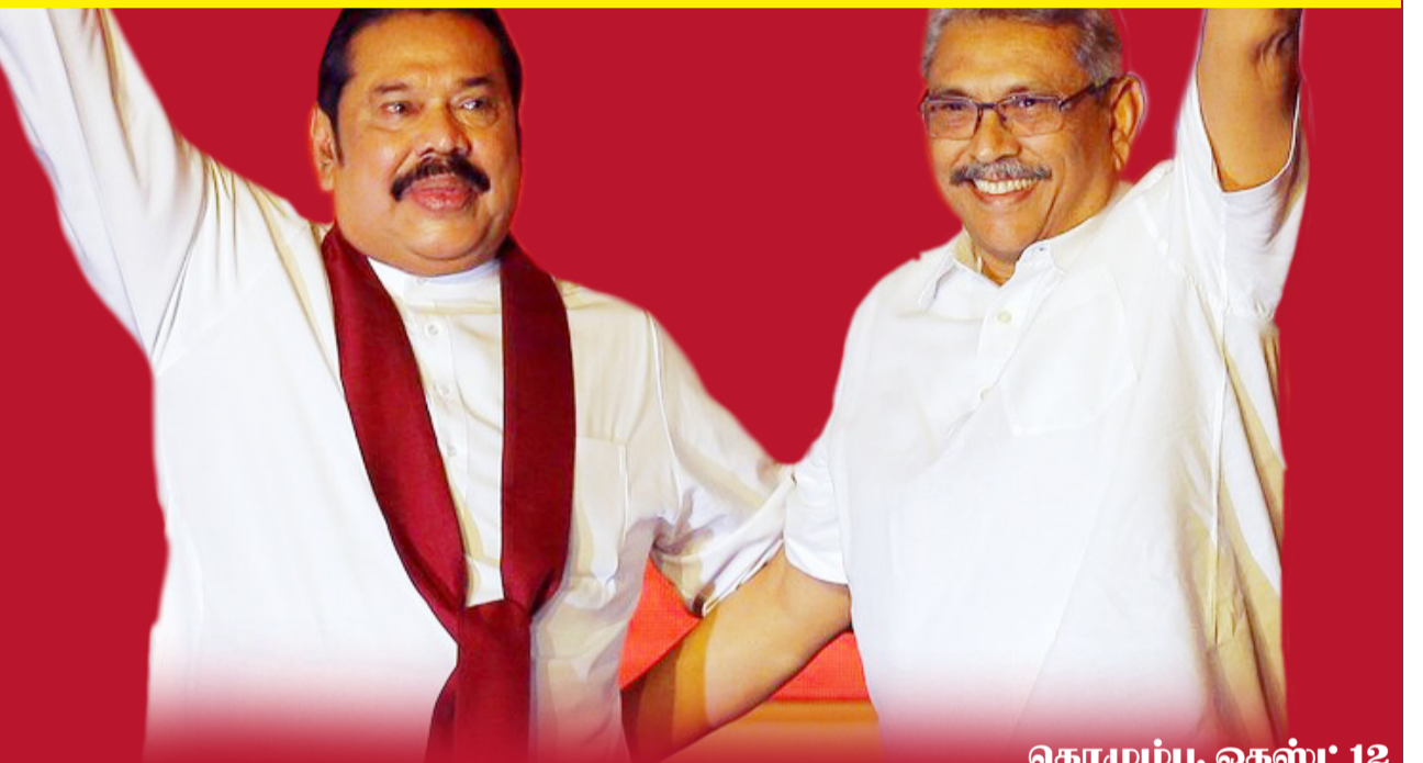
கொழும்பு, ஓகஸ்ட் 12 ஸ்ரீலங்கா பொதுஜன முன்னணியின் ஜனாதிபதி வேட்பாளராக கோட்டாபய ராஜபக்ஷ வேட்பாளர் என முன்னணியின் புதிய தலைவரான மஹிந்த ராஜபக்ஷ நேற்று அறிவித்தார். பக்கம் 10 >>>