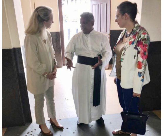
கொழும்பு, ஓக. 12 இலங்கைக்கு அதிகாரபூர்வ பயணத்தை மேற்கொண்டுள்ளதற்கு, மத்திய ஆசிய விவகாரங்களுக்கான அமெரிக்காவின் பதில் உதவி பக்கம் 10 >>>