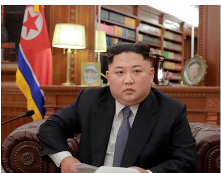
வொஷிங்டன், ஓக. 14

ஏவுகணை சோதனைகளுக்காக வடகொரியத் தலைவர் தம்மிடம் கடிதம் மூலம் மன்னிப்புக் கேட்டார் என அமெரிக்க அதிபர் டிரம்ப் தெரிவித்திருக்கிறார்.