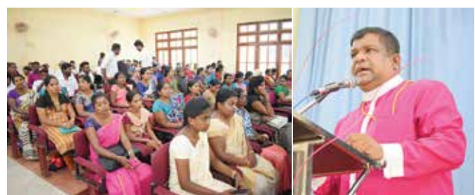
இணைந்து ஏற்பாடு செய்த இந்த கருத்தரங்கு நகரசபை கலாச்சார மண்டபத்தில் இடம்பெற்றது.

வவுனியா பிரதேச செயலகம் மற்றும் இறம்பைக்குளம் சஷி மிஷன் பூரண சுவீச்சு சபை