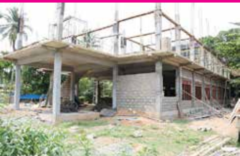
முற்பது மில்லியன் ரூபாசெலவில் தன்னார்வ தொண்டு நிறுவனத்தின் மூலம் அமைக்கப்பட்டு வருகின்றது குறிப்பிடத்தக்கது.

இச் நிலையத்திற்கான மூன்று மாடிகளைக்கொண்ட புதிய கட்டடம்