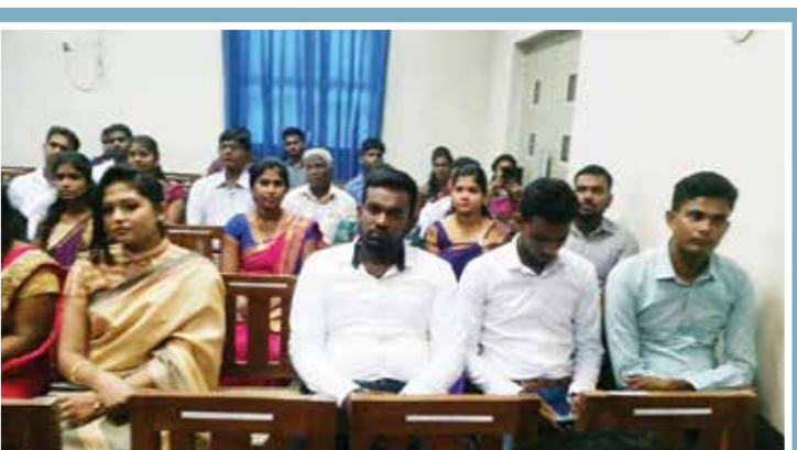
ஏற்கனவே, புத்தளத்தில் அமைக்கப்பட்ட நுரைச்சோலை அனல் மின் நிலையத்தினால் வரக்கூடிய பாதிப்புகள் பற்றி முன்கூட்டியே கரும் எதிர்ப்பு இயக்கங்கள் முன்னெடுக்கப்பட்டன. ஆனால் அவற்றை கவனத்தில் கொள்ளாது சுற்றுச்சூழலில் இணைந்து கொள்கிறது என கட்சியின் பொதுச்செயலாளர் சி.கா செந்திவேல் தெரிவித்தார்.