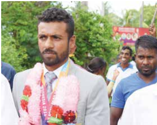
கள், ஊர்மக்கள் எனப்பலரும் கலந்து கொண்டனர்.

இதேவேளை, குறித்த இளைஞர் கடந்த 2016ஆம் ஆண்டு ரூபாய் நாட்டில் நடையெற்ற ஆசிய விளையாட்டில் 100 மீற்றர், 200 மீற்றர் ஓட்டம், உயரம் பாய்தலில் பங்கு பெற்ற பதக்கங்களை வென்றிருந்தார் என்பதும் குறிப்பிடத்தக்கது.