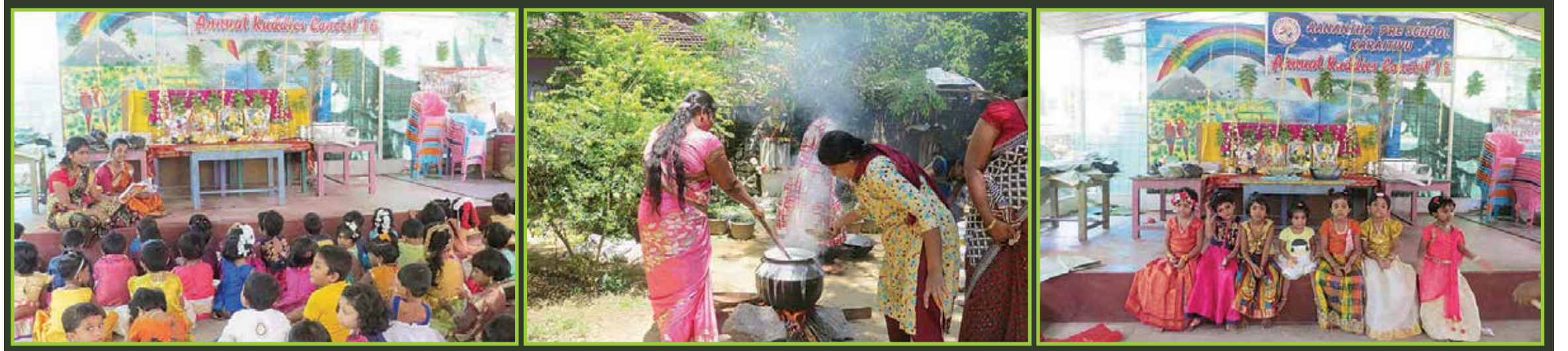
காரைதீவு ஆனந்தா முன்பள்ளியில் கடந்த வெள்ளிக்கிழமை வாணி விழா கொண்டாடப்பட்டபோது மாணவச் செல்வங்கள் ஆசிரியர்களுடன்செயற்பாடுகளில் ஈடுபடுவதை காணலாம்.