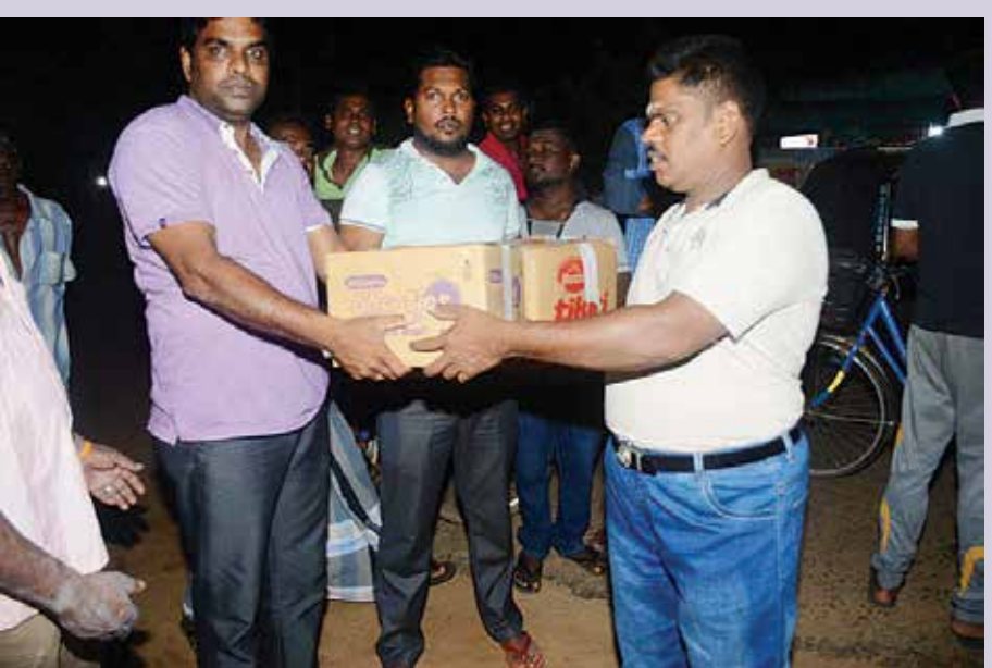
படம்: பெரியகல்லாறு திருபர்

முன்னய காலங்களில் மூதூரிலிருந்து தோப்பூர் ஊடாக பள்ளிக்குடியிருப்புக்கு நடைபெற்று வந்த இ.போ.ச பஸ் சேவைகள் பின்னர் தடைப்பட்டதாகவும் பொதுமக்கள் குறிப்பிடுகிறார்கள். இவைகளையெல்லாம் கருத்திற்கொண்டு இ.போ.ச பஸ் சேவையொன்றை மூதூரிலிருந்து பள்ளிக்குடியிருப்பு வரை நடாத்தவேண்டுமென்பதே இங்குள்ள பொதுமக்களது உருக்கமான கோரிக்கையாகும்.