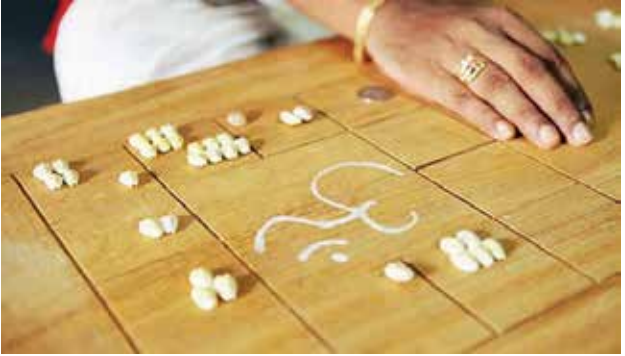
249 வரை உள்ள வரிசை எண்களில் தொகுக்கப்பட்டுள்ளது. பிரசன்ன ஜோதிடம், வாடிக்கையாளரிடம் 1 முதல் 249 உள்ள எண்களில் ஏதாவது ஒரு எண்ணை குறிப்பிடுமாறு கூறுவார். வாடிக்கையாளர் எந்த எண்ணை குறிப்பிடுகின்றாரோ அந்த எண்ணிற்குரிய உபநட்சத்திரமே லக்ஷண பாவ உபநட்சத்திரமாக அமையும். அதாவது அந்த எண்ணின் வரிசைக்குரிய உபநட்சத்திரத்தின் பாகையே,

ஒரு வேளை விதியின் படி இவ்விரு பாவங்களும் சம வலுவுடன் இருந்து, மதி என்கிற நடப்பு தகராழ்தன் இவ்விரு பாவங்களில் ஏதாவது ஒன்றை பாக்கவில்லை எனில், இவ்விரு பாவங்களில் எதை செய்தாலும் பெரிய வித்தியாசம் வராது என்பதே இங்கு அர்த்தமாகும். ஆனால் ஜோதிடர் இதை ஆதாரமாகக் கொண்டு உத்தியோகம் அல்லது சொந்தத் தொழில் இவற்றில் எதை செய்தாலும் உனக்கு நன்மையே என்று