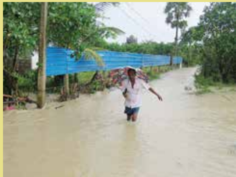
துணுக்காய் பிரதேச செயலாளர் 02 ஆம் பக்கம் பார்க்க

பிரதேச செயலக பிரிவில் 2,322 குடும்பங்களைச் சேர்ந்த 7,286 பேர் வெள்ள அனர்த்தத்தினால் பாதிக்கப்பட்டுள்ளனர். அப்பிரதேசத்தில் 542 வீடுகள் பகுதியளவில் சேதமடைந்துள்ளன. புதுக்குடியிருப்பு பிரதேச செயலக பிரிவில் 5,285 குடும்பங்களைச் சேர்ந்த 16,860 பேர் பாதிக்கப்பட்டுள்ளனர். அவர்களில் 1, 265 குடும்பங்களைச் சேர்ந்த 807 பேர் 3 தற்காலிக முகாம்களில் தொடர்ந்தும் தங்கவைக்கப்பட்டுள்ளனர். அப்பிரதேசத்தில் 82 வீடுகள் முழுமையாகவும் 1, 681 வீடுகள் பகுதியளவிலும் சேதமடைந்துள்ளன.