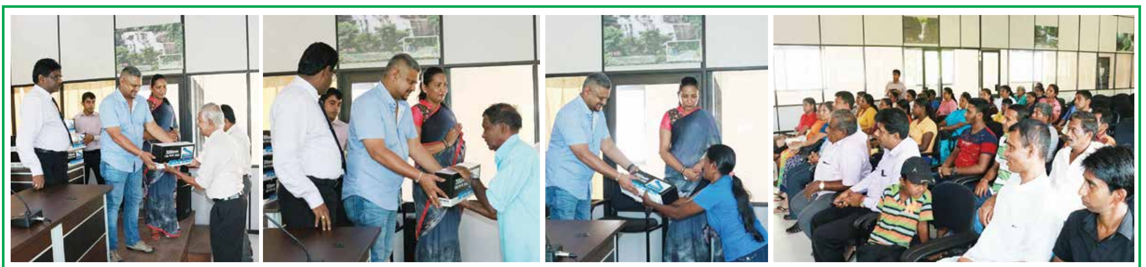
கேகாலை மாவட்ட பாராளுமன்ற உறுப்பினர் கனக ஹேரத்தின் ஆலோசனைக்கு அமைய கேகாலை மாவட்டத்தில் ஆரம்பிக்கப்பட்ட தருநோதய வேலைத்திட்டத்தின் கீழ் கேகாலை மாவட்டத்தில் வருமை கோட்டின் கீழ் வாழும் மக்களுக்கு மேலும் பல சுயத்தொழில் ஊக்குவிப்பு திட்டங்கள் ஆரம்பிக்கப்பட்டன. இதன் அடிப்படையில் யட்டியாந்தோட்டை பிரதேச செயலகத்தின் கீழ் வாழும் வருமை குடும்பங்களுக்கு காளான் உற்பத்தி குறித்து பயிற்சிகள் வழங்கப்பட்டது.