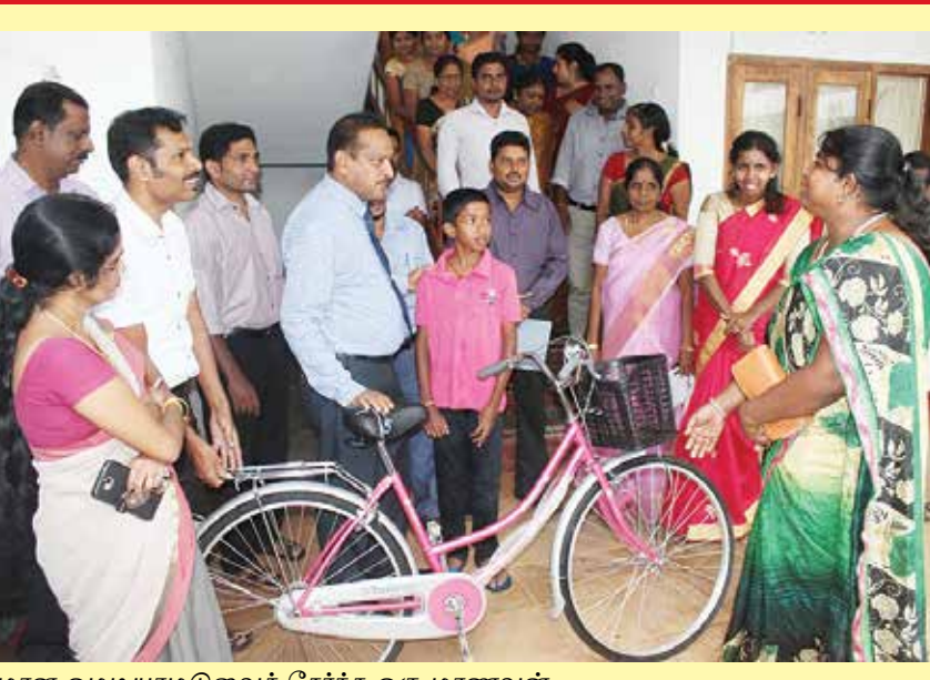
மாண ஓமடியாமடுவைச் சேர்ந்த ஒரு மாணவன் புலமைப்பரிசில் பரிசையில் 150 புள்ளிகளைப் பெற்றுக்கொண்டமையானது அரசாங்க அதிபரால் பாராட்டப்பட்டதுடன் தொடர்ச்சியான கற்றலின் மூலம் சிறந்ததொரு கல்வியாளனாக எதிர்காலத்தில் திகழவேண்டும் என்றும் வாழ்த்தினார். தேசிய உரச் செயலகத்தினால் ஏற்பாட்டில் இத்துவிச்சக்கர வண்டிய வழங்கும் நிகழ்வு ஏற்பாடு செய்யப்பட்டிருந்