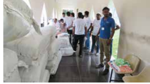
வெள்ளத்தால் பாதிக்கப்பட்ட மக்களிற்கு லைக்கா ஞானம் பவுண்டேசனால்

உதவிகள் வழங்கப்பட்டன. கிளிநொச்சி மாவட்ட செயலகத்திற்கு சென்ற குழுவினர் கிளிநொச்சி மாவட்ட அரசாங்க அபிவிருத்தி கலந்துரையாடினர். தொடர்ந்து ஒரு தொகுதி உதவிகளை கிளிநொச்சி மாவட்ட அரசாங்க அபிவிருத்தி கலந்துரையாக அவர்களிடம் கையளித்தனர்.