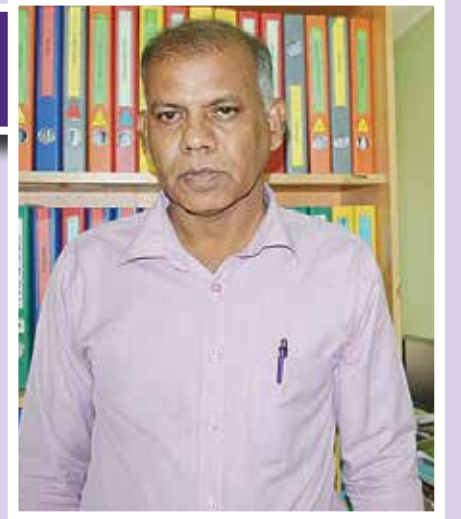
பல விவசாயிகள் நஷ்டத்தை எதிர்கொண்ட நிலமை நேரிடும்.

எனவே சோளம் விவசாயிகளின் பட்டாளப்புழுவின் தாக்கத்தில் இருந்து மீண்டால் மாத்திரமே தங்களுடைய வறுமனைத் தாக்கக் கொள்ள முடியும். இல்லையேல் வேளாண்மை மூலம்