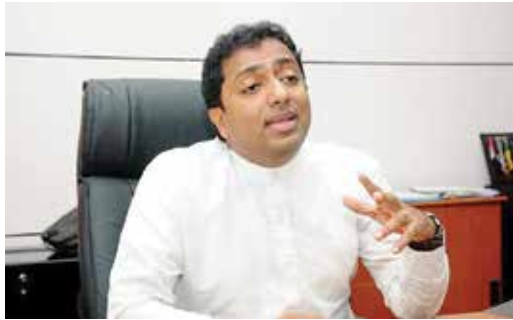
வவுச்சர்கள் மூலம் சீருடை துணிகளை கொள்வனவு செய்யும் மாணவர்களுக்கு

பாதிப்பு ஏற்படாத வகையில் செயற்படுமாறு அமைச்சர் அக்கில விராஜ் காரியவசம் உரிய தரப்புக்களிடம் கோரிக்கை விடுத்துள்ளார்.