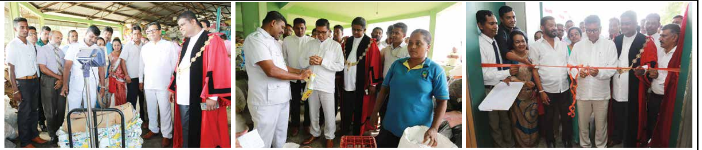
அரசாங்கத்தின் மூலம் 570 இலட்சம் ரூபா செலவில் இரத்தினபுரி கணாந்தொல பிரதேசத்தில் கழிவு பொருட்கள் மீள்சுழற்சி செய்து அதன் மூலம் கொம்போஸ் உரம் தயாரிக்கும் மத்திய நிலையம் ஒன்று மக்கள் பாவனைக்காக திறந்து வைக்கப்பட்டது. இரத்தினபுரி மாநகர சபை மற்றும் நிவித்திகல பிரதேச சபைக்குறிப்பட்ட பிரதேசங்களில் நாளாந்தம் சேர்க்கப்படும் 40 டொன் கழிவு பொருட்கள் மற்றும் 30000 மலசல கழிவுகள் என்பன மீள்சுழற்சி செய்யப்பட்டு அதன் மூலம் 8 டொன் கொம்போஸ் உரம் தயாரிக்கப்பட்டு வருடத்திற்கு 50 இலட்சம் வரை இரத்தினபுரி மாநகர சபைக்கு ஆதாயம் பெற கூடிய வழிமுறைகளும் மேற் கொள்ளப்பட்டுள்ளது.