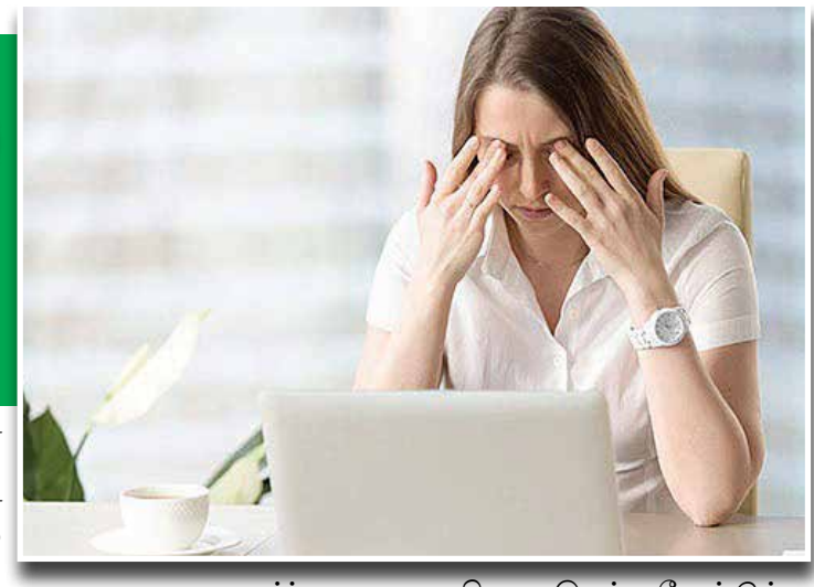
ராந்து அமர வசதியாக இருக்க வேண்டும். பாதங்கள் தரையில் படும் படியாக இருக்க வேண்டும்.

20-20-20 விதி கம்ப்யூட்டரில் தொடர்ந்து வேலை செய்பவர்கள் 20 நிமிடத்திற்கு ஒரு முறை, 20 வினாடிகளுக்கு, 20 அடிக்கு மேலான தொலைவில் உள்ள பொருட்களை பார்க்க வேண்டும். தொலைவில் பார்ப்பது கண்களுக்கு ஓய்வு தரும். அருகாமையில் பார்ப்பது கண்களுக்கு அதிக வேலை கொடுப்பதற்கு சமமாகும். பழைய சி.ஆர்.டி மானிட்டர்களை பயன்படுத்துவோர் ஆன்டிகிளார் ஸ்க்ரீன் மானிட்டருக்கு முன்பாக மாட்டிக் கொள்ளலாம். புதிய எல்.இ.டி மானிட்டர்களுக்கு இது தேவையில்லை. மின் விளக்குகள் மற்றும் ஜன்னல்கள் கண்களுக்கு எதிராக இருப்பதை தவிர்க்க வேண்டும். ஏர் கண்டிஷனர் ஏசி காற்று நேராக முகத்தில் அல்லது கண்களில் படும் படியாக அமரக்கூடாது.